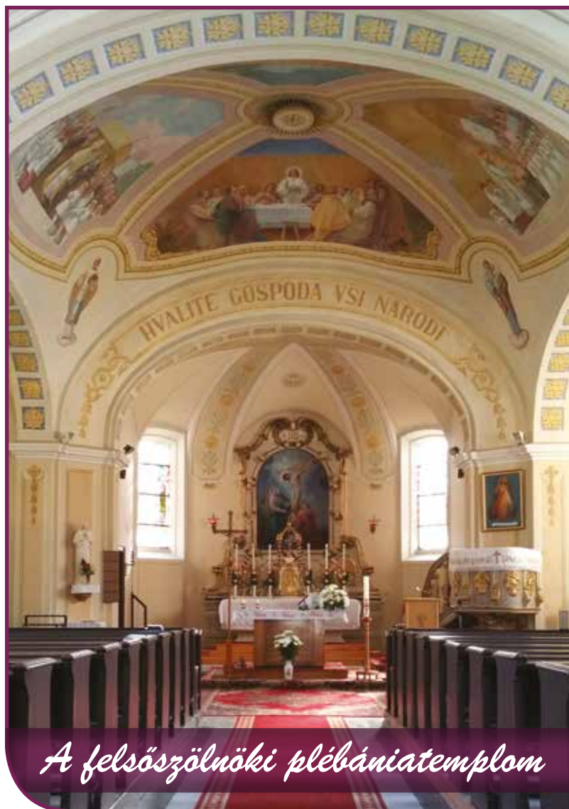
A felsőszölnöki plébániatemplom