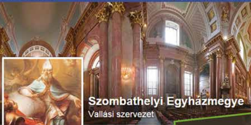
Szombathelyi Egyházmegye Vallási szervezet