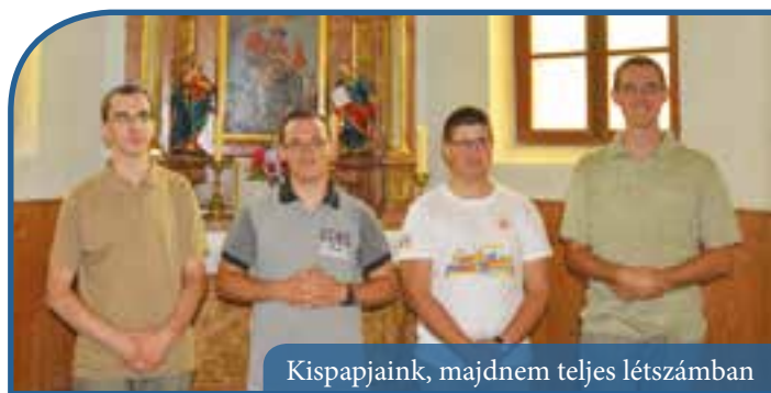
Kispapjaink, majdnem teljes létszámban