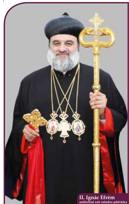
II. Ignác Efrém antióchiai szír ortodox pátriárka