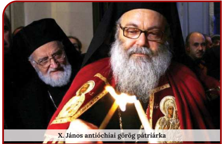
X. János antióchiai görög pátriárka

Antióchia az 1. század végére minden téren a keresztény vallás és kultúra fellegvárává változott. Ebben az időben az