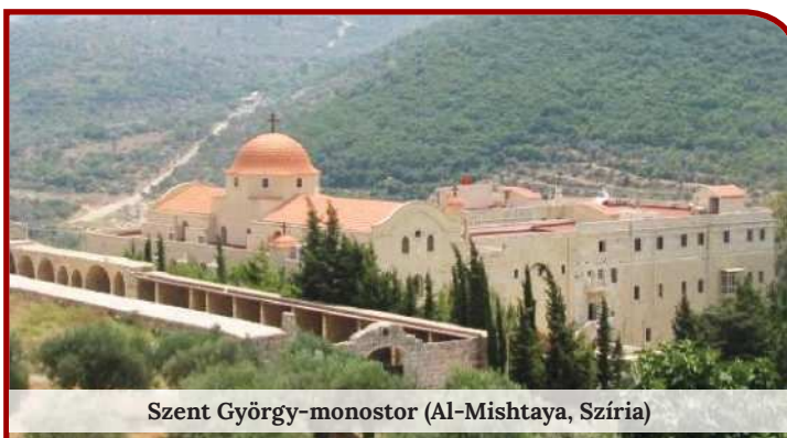
Szent György-monostor (Al-Mishtaya, Szíria)