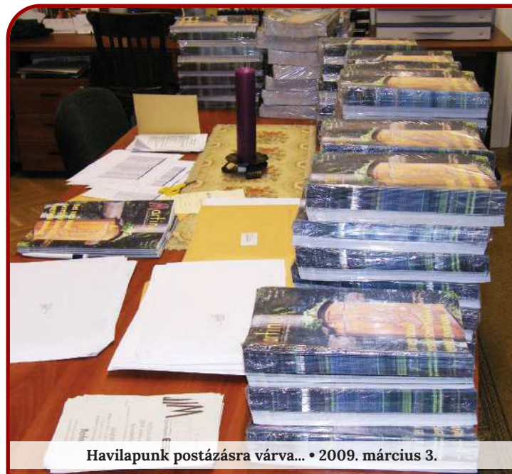
Havilapunk postázásra várva... • 2009. március 3.

Hogy van-e létjogosultsága ma a katolikus sajtónak, talán nehéz kérdésnek tűnik. Hozhatjuk az indokokat a nemleges