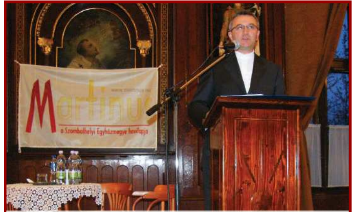
Martinus-Est (Szombathely) • 2009. március 11.