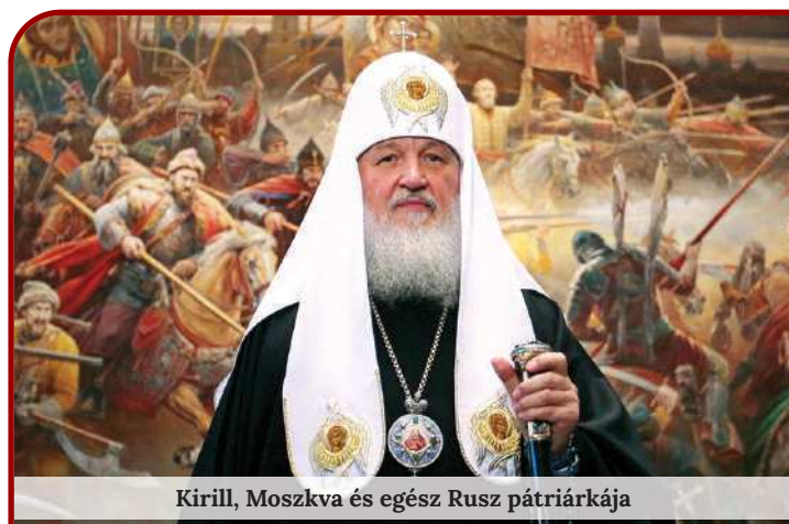
Kirill, Moszkva és egész Rusz pátriárkája

Majd 1803-tól a Buda(pest) közeli Üröm községbe helyeződött át a magyarországi orosz ortodox misszió központja, ekkorra és itt készült el ugyanis a két évvel korábban elhunyt Alekszandra Pavlovna Romanova nagyhercegnő ortodox sírkápolnája, aki József nádornak, I. Ferenc osztrák császár öccsének volt a felesége.