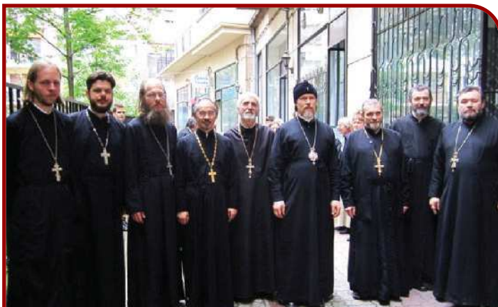
A magyarországi orosz ortodox egyházmegye papjai korábbi főpásztoruk társaságában

Az orosz ortodoxok magyarországi jelenléte a 18. század elejére nyúlik vissza, amikor Nagy Péter cár több száz kozákot küldött Tokajba, azzal a feladattal, hogy a híres bortermő vidékről folyamatosan ellássák az cári udvart. Ők építették fel a Magyarország területén álló első orosz ortodox templomot.