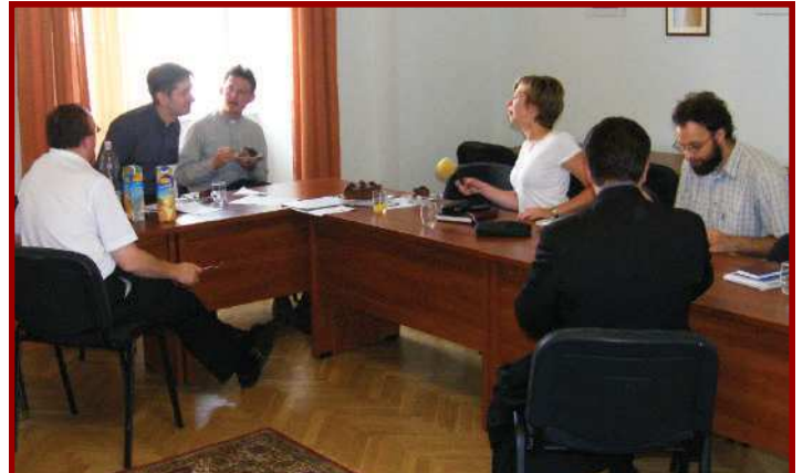
Szerkesztőségi megbeszélés • 2009. augusztus 8.