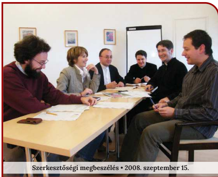
Szerkesztőségi megbeszélés • 2008. szeptember 15.

Martinus www.martinus.hu a Szombathelyi Egyházmegye havilapja