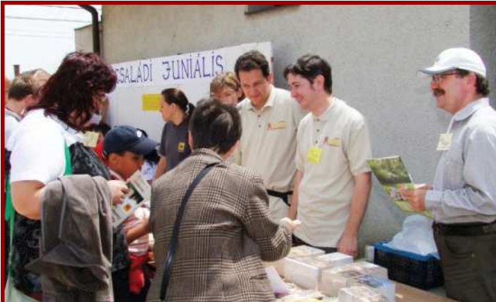
Családi Juniális (Szentpéterfa) • 2009. június 6.