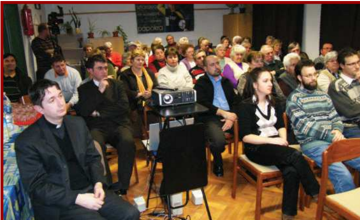
Martinus-Est (Jánosháza) • 2010. február 24.