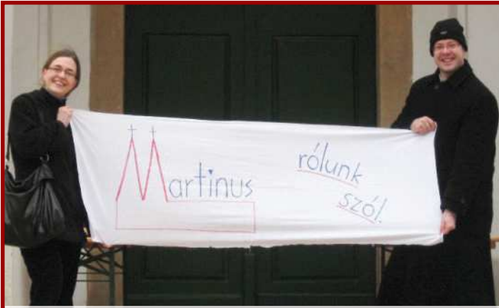
Bemutatkozik a Martinus (Zalaegerszeg) • 2009. február 15.