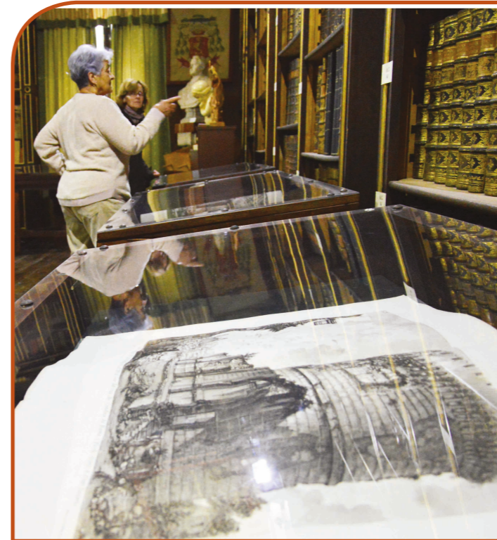
Piranesi kiállítás Szombathelyen

▲ Október 3-án megnyílt a Szombathelyi Egyházmegyei Könyvtár legújabb kiállítása, amelyen Piranesi rézmetszeteiből látható válogatás. Az idei esztendőben emlékezünk meg Piranesi halálának 240. évfordulójáról.