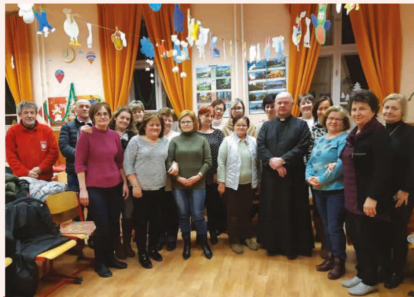
Karitás Csoport alakult Sárváron „Jótetteiteket látva dicsőítsék mennyei Atyátokat!” (Mt5,15)