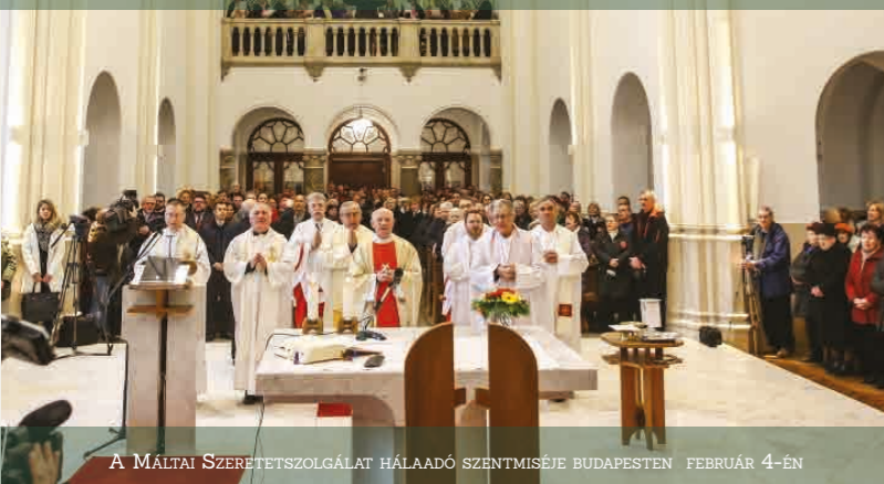
A MÁLTAI SZERETETSZOLGÁLAT HÁLAADÓ SZENTMISEJE BUDAPESTEN FEBRUÁR 4-ÉN