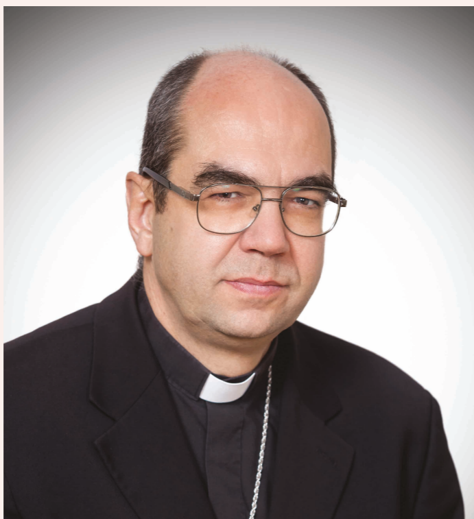
Húsvéti fények Dr. Székely János megyéspüspök gondolatai

vagyunk felelősek, hanem sokak életéért is. Egy orvosnő egyszer meglátott a kórház folyosóján egy könnyes szemű fiatalasszonyt. Bár nem az ő betege volt, leült vele egy kicsit beszélgetni. Lassan kiderült, hogy az asszony gyermeket vár, de úgy tűnik, minden az abortusz mellett szól. A doktornő több mint egy órán át hallgatta az asszonyt, bátorította, fényt gyújtott a szívében, azután elbúcsúztak. Eltelt néhány