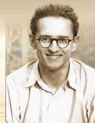
BOLDOG BRENNER JÁNOS VÉRTANÚ ÜZENETE

A kiadvány ára csak 2.400 Ft, amely elérhető a Szombathelyi Egyházmegye könyvesboltjában, a Püspöki Palota mellett (9700 Szombathely, Berzsényi tér 3.), illetve a webshopban ( www.martinuskiado.hu .)