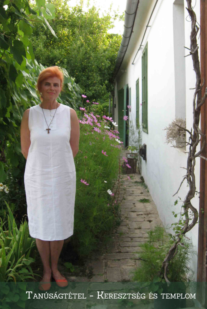
TANÚSÁGTÉTEL – KERESZTSÉG ÉS TEMPLOM

Idén Vízkeresztkor Ferenc pápa arra szólított fel bennünket, hogy ünnepeljük meg a keresztelésünk napját is. Ezt a dátumot nem ismertem eddig, ezért a születési helyem plébánosához fordultam segítségért, aki egy szép emléklappal ajándékozott meg, amely tartalmazza a szükséges adatokat. Igen nagy meglepetés ért, mert ebből kiderült, hogy három napos koromban kereszteltek meg. Édesapám római katolikus volt, édesanyám pedig görög katolikus, és az akkori szokás szerint az édesapa után kereszteltek. Mivel azonban a gyerekek nevelése az édesanyák dolga volt – így a hitéletre nevelés is – anyukám a római templomba járt velünk és ott kaptuk meg a további szentségeket is.