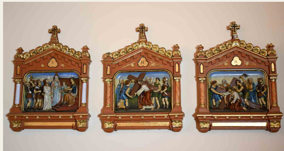
Fotó: Keresztút. Eszetregnye, Nagyboldogasszony-templom

A nagyböjti kegyelmi idő alatt a személyes életünkben kell, hogy a régi új legyen, a halott életre keljen, és a rossz jóvá alakuljon. Ennek az átalakulásnak az igazságáról beszél Pál apostol és erre a megújulásra biztat mindnyájunkat. Krisztusban, a keresztségben Isten életre keltett minket, bűneinkben halottakat. Ha nem szakítunk bűneinkkel, akkor az élet forrásától, Istentől eltávolodunk és a halál lesz osztályrészünk. Döntenünk kell: élet vagy halál, Isten vagy a bűneink?! Krisztusban, a keresztségben, a jótettekre lettünk újjá teremtve. Nem elég tehát nem megtenni a rosszat, elhagyni a bűnt; hanem meg kell tenni a jót is, amire lehetőségünk van. Nyitott szívvel, nyitott füllel és nyitott szemmel kell járnunk minden nap, hogy észrevegyük azt, aki rászorol segítségünkre.