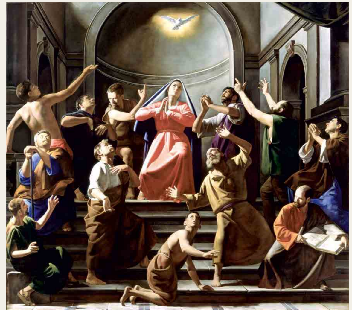
KISLÉGHI NAGY ÁDÁM: A SZENTLÉLEK ELJÖVETELE, 2003, SZOMBATHELYI SZÉKESEGYHÁZ