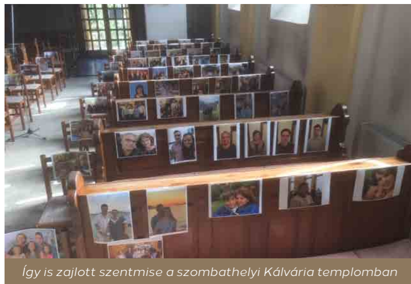
Így is zajlott szentmise a szombathelyi Kálvária templomban