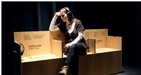
Egyházüldözés a kommunista diktatúra ideje alatt