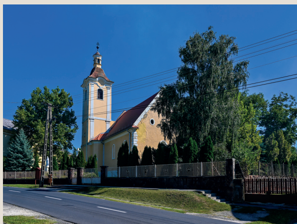
Szepetnek, Szent Őrzőangyalok-templom Búcsú: október 2.