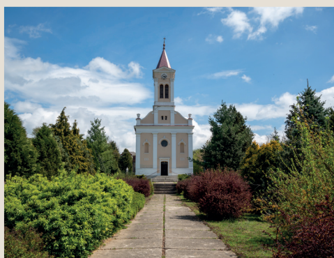
Eszteregnye, Nagyboldogasszony-templom Búcsú: augusztus 15.