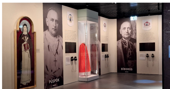
„Szeretetet hoztam ide is” Mindszenty-életútkiállítás

Bővebb információ a www.mindszentyneum.hu oldalon olvasható.