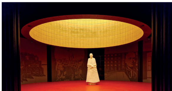
Rieger Tibor Mindszenty-szobrának gipszmintája