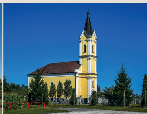
Sormás, Szent Rókus-templom Búcsú: augusztus 16.