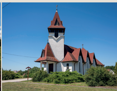
Nagykanizsa-Bajcsa, Magyarok Nagyasszonya-templom Búcsú: október 8.