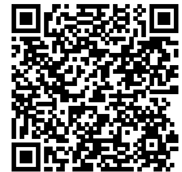
A beszélgetést a QR-kód alatti linkben teljes egészében meghallgathatják.