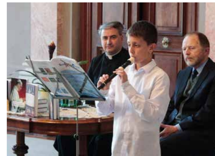
Könyvbemutató a Püspöki Palotában, 2025. május 23.