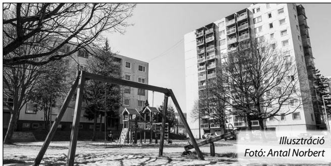
Illusztráció