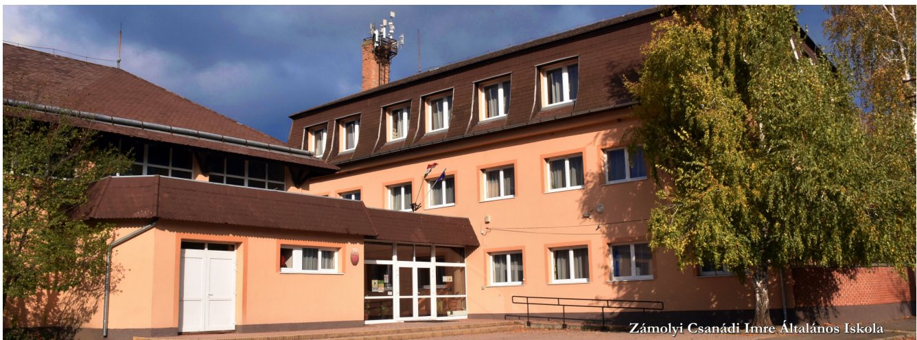
Zámolyi Csanádi Imre Általános Iskola