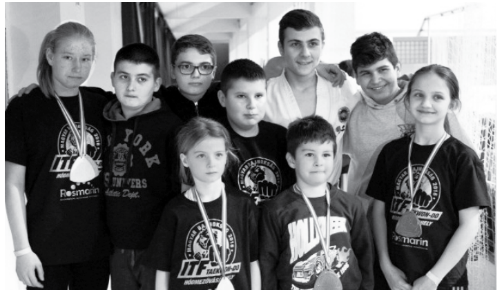
Néhány fotó a versenyek résztvevőiről (válogatás)