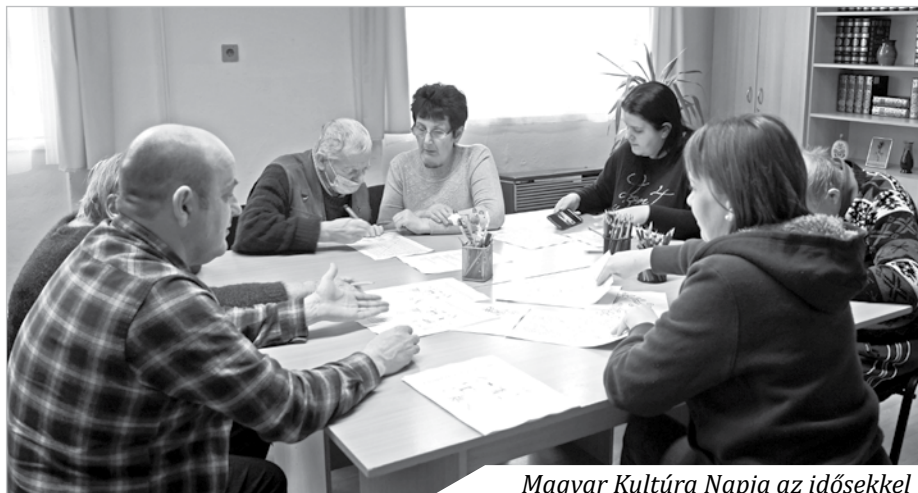
Magyar Kultúra Napja az idősekkel

A Magyar Kultúra Napja alkalmából a battonyai Gondozási Központ idősklubjának tagjai és munkatársai voltak vendégeink. Műveltségi kvízzel, szókeresővel és színezőkkel készültünk számukra. A feladványok megoldása közben felelevenedtek a régi szokások, hagyományok. A foglalkozás zárásaként közösen megnéztük Latabár Kálmán főszereplésével A képzett beteg