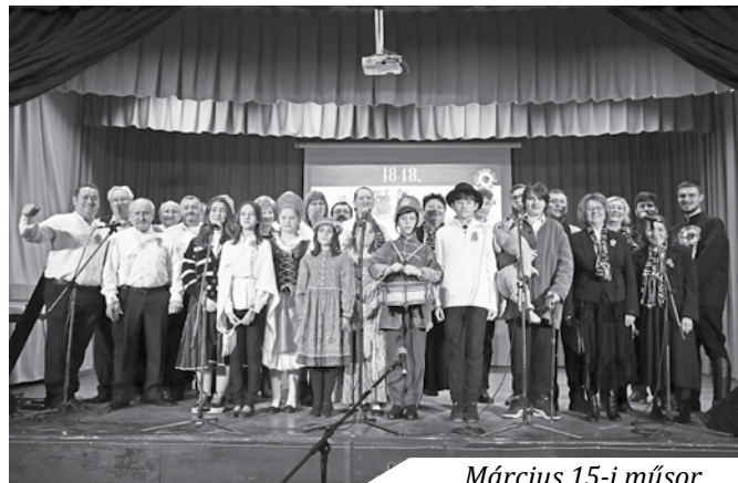
Március 15-i műsor