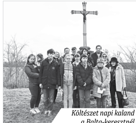
Költészet napi kaland a Balta-keresztnél