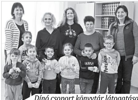
Dínó csoport könyvtár látogatása

A Molnár-C. Pál Emlékház, a Művelődési Ház és a Battonyai Városi Könyvtár továbbra is szeretettel vár minden érdeklődőt!