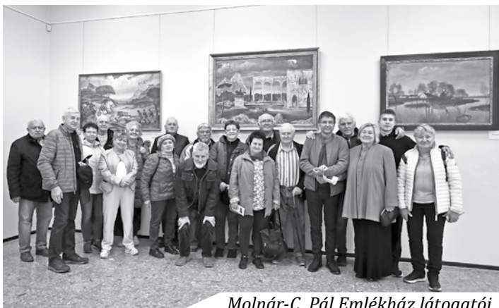
Molnár-C. Pál Emlékház látogatói