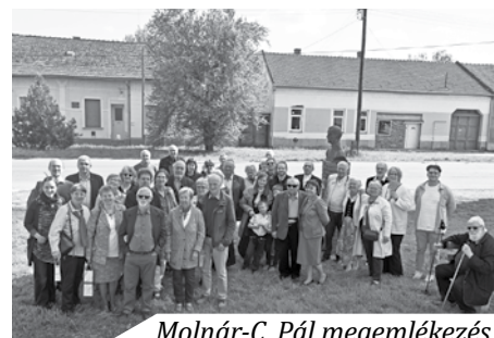
Molnár-C. Pál megemlékezés