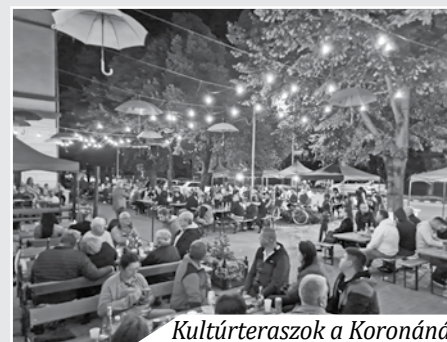
Kultúrteraszok a Koronánál