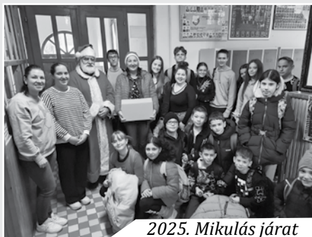
2025. Mikulás járat