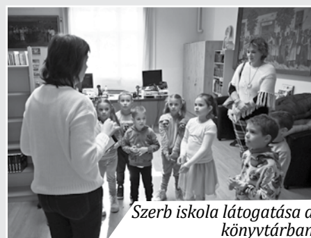
Szerb iskola látogatása a könyvtárban