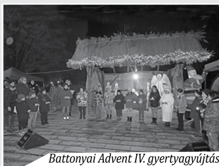
Battonyai Advent IV. gyertyagyújtás