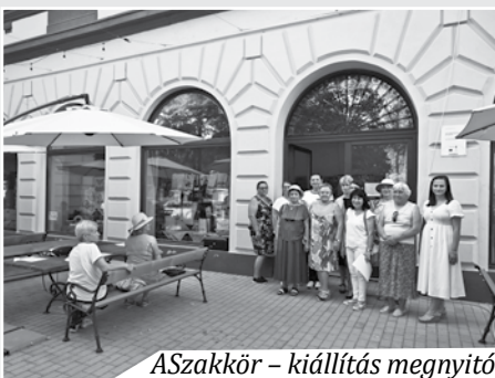
ASzakkör – kiállítás megnyitó