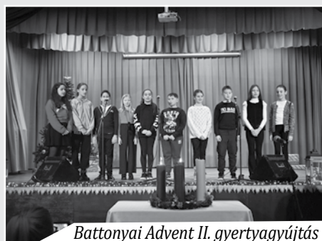
Battonyai Advent II. gyertyagyújtás