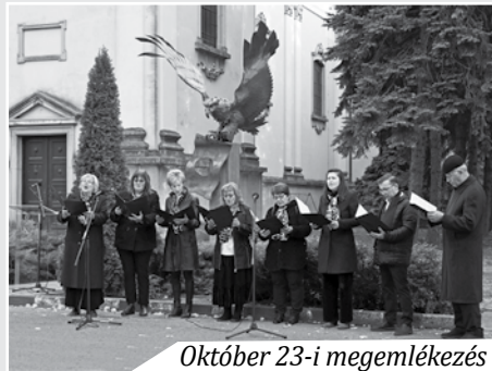
Október 23-i megemlékezés