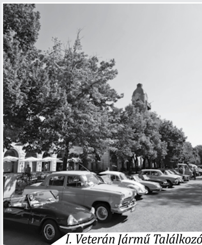
I. Veterán Jármű Találkozó