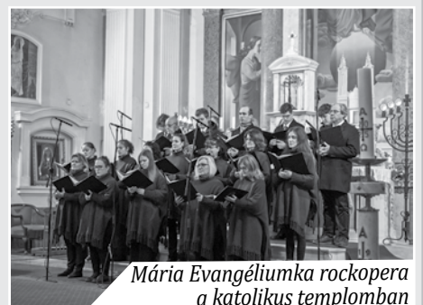
Mária Evangéliumka rockopera a katolikus templomban