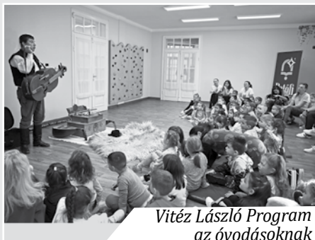
Vitéz László Program az óvodásoknak