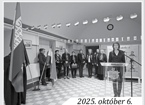
2025. október 6.