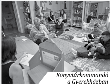
Könyvtárkommandó a Gyerekházban