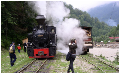
„Mocanita”, a Vaser-völgyi kisvasút

A táborozók létszáma tavaly is meghaladta a 60-at, szép számmal voltak rovarász szakemberek (MRT-tagok!), és ami még ennél is fontosabb, közel két tucat fiatal hallgató. Az időjárásról azért annyira nem volt szerencsénk, mivel hiába nevezték globálisan a 2010-es évet a legszárzabbnak, nálunk, és a hegyekben még inkább, kimondottan csapadékos volt (poénkodtunk is rajta, hogy nem „rovarász-” hanem „gombásztábornak”