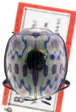
Kaszab Zoltán által 1980-ban leírt gyászbogárfaj paratípusa

Ábraoldal Kaszab Zoltánnak az Arab-félsziget hólyaghúzóit bemutató monográfiájából