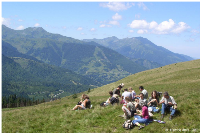
Ebéd a Máramarosi-havasok gerincén. Háttérben a Radnai-havasok, jobboldalt az első csúcs, a Nagy-Pietrosz (2303 m)

kellett volna átkeresztelnünk.... Rengeteg rókagombát szedtünk).