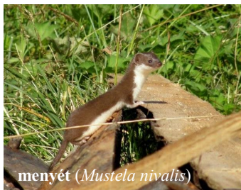
menyét ( Mustela nivalis )

kellett volna átkeresztelnünk.... Rengeteg rókagombát szedtünk).