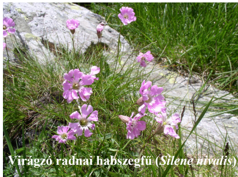
Virágzó radnai habszegfű ( Silene nivalis )