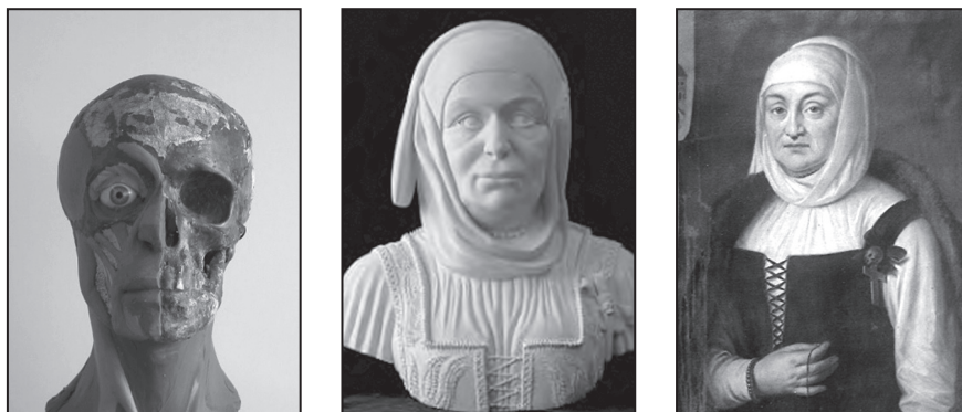
3. ábra: Plasztikus arcrekonstrukció és egy hitelesnek tartott képi ábrázolás

2011-ben Hesztera Aladár restaurátor a fém koporsót teljesen kiürítette, hogy a viselet- és koporsó rekonstrukcióhoz szükséges valamennyi fennmaradt tárgyi emlék rendelkezésre állhasson.