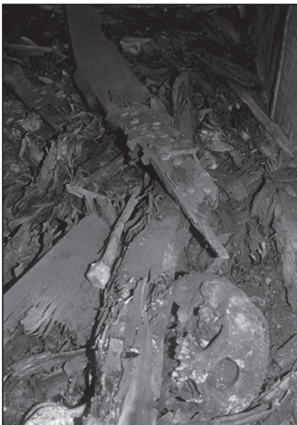
2. ábra: Szétdőlt maradványok a bronz koporsóban

Az anatómiai rendben történő rendszerezés kapcsán további, a koporsóba utólagosan bedobált, másodlagosan bekerült, más személyekhez tartozó csontanyagot is sikerült elkülöníteni. Az eredetileg betemetett holttest csontmaradványaként pizlékeny, mállékony calvariumot, sérült állkapcsot és vázcsont-töredékeket sikerült a vizsgálatokba bevinni. A bomlás és a klimatikus viszonyok következtében a koponya lapos csontjainak mindkét felszíne lemezesen erodált. A bal oldali parietalén a tuber parietale és a lambda pont között oldódásos felmaródás, a közepén lyukkal. A planum occipitale területén baloldalt oldódásos, horpadt lyuk. Bal processus mastoideus csúcsa letört. Bal oldali járomív hiátussal járó törése. Orrcsontok sérültek. Arckoponyán füstös jellegű elszíneződések. A koponya egésze barnás (szürkésen), sötétén elszíneződött. Állkapocs jobb oldali ramusa törött, hiányzik, vége elszenesedett. Jobb oldali fognegyedben a fogak hő hatására széttöredeztek. Az M7-es különálló koronája elszenesedett. A rövid fogívben a bölcsességfogak anatómiailag hiányoznak. Az életben történt részleges fogvesztéseken kívül a felső fogívben két cystosus abscessus nyoma felismerhető. A koponya nem deformálódott, felülnézeti alakja pentago-rhomboid, hátulnézetben ház alakú. A homlok előreugró, a három jellegzetes anatómiai tájon depressio nincs. A nyakszirt íve curvoccipitalis.