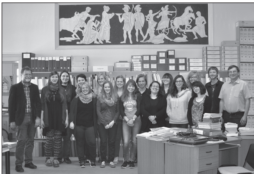
Bild 5. Die Exkursionsgruppe im Forschungszentrum für Europäische Ethnologie.