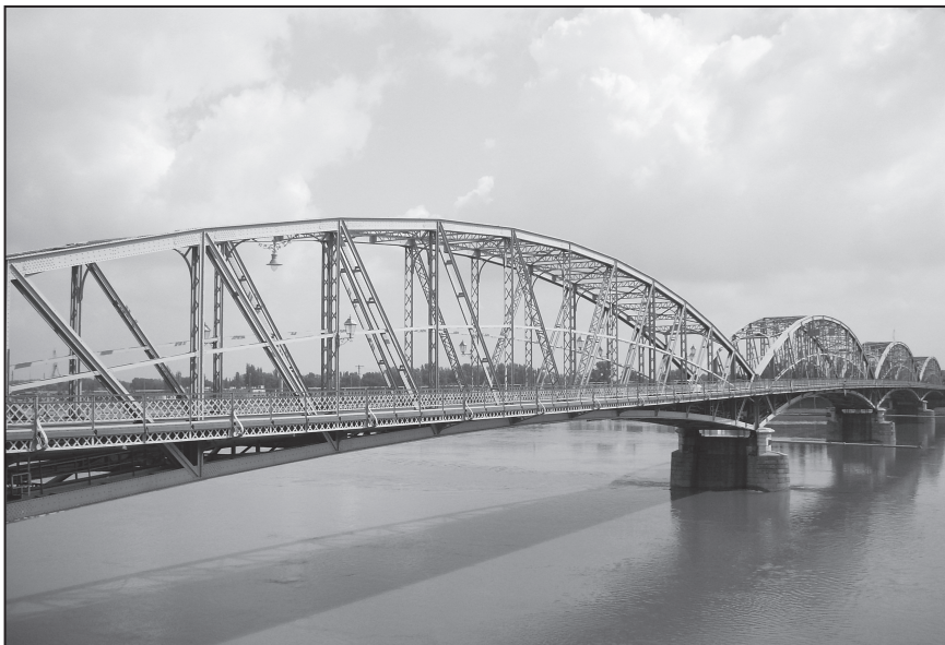
Bild 4. Die Donau und die Brücke, die Verbindung und Grenze in einem ist.