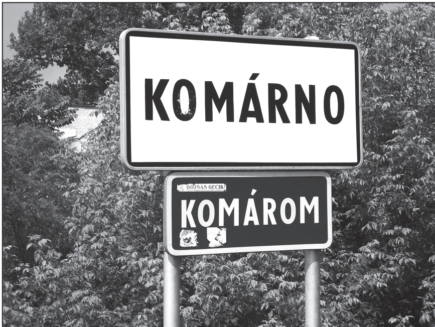
Bild 1. Komorn, eine Stadt – zwei Sprachen