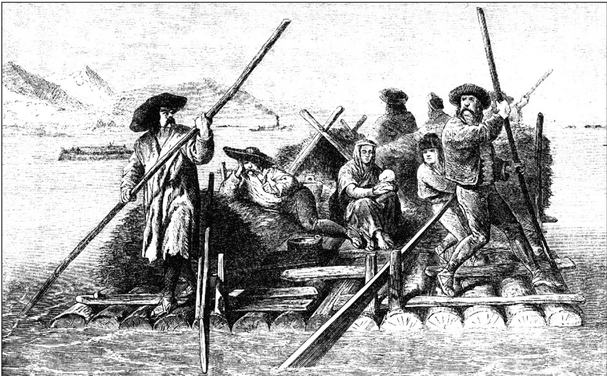
Abb. 1.: Slowakische Flößer (nach Nagy 1870, I: 66)

Diese kurze Anordnung lässt darauf schließen, dass es vorher viele Unfälle, Auseinandersetzungen und Prozesse gab zwischen den Wassermüllern und den auf dem Fluss Gran abwärtsfahrenden slowakischen Flößern, bzw. den höchstwahrscheinlich aufwärtsfahrenden Schiffschleppern (es ist durchaus möglich, auch dazu einmal Angaben im Archiv zu finden). Das Aufeinanderangewiesensein der Parteien, bzw. ihre wirtschaftliche Abhängigkeit voneinander, lässt aber vermuten, dass solche Konflikte nicht charakteristisch für dieses Beziehungssystem gewesen sein dürften. Auf der langen, nicht ganz gefahrlosen Strecke ergaben sich unzählige Möglichkeiten bzw. der Zwang, in Kontakt mit der Bevölkerung der zu passierenden Orte zu treten.