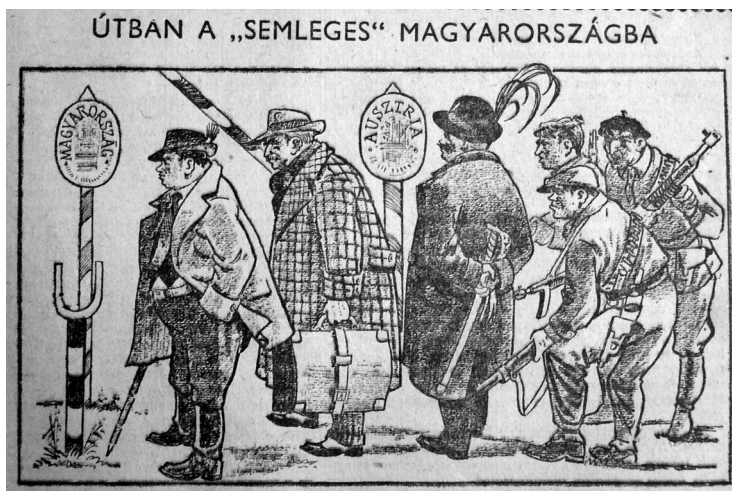
1. kép: Gúnyrajz az Új Szó 1956. november 1-jei különszámából

A Csehszlovák Sajtóiroda hírei mellett – természetesen a forrás megjelölése nélkül – megjelentek bennük a Rudé právo ból átvett vezércikkek és kommentárok éppúgy, mint a hűségnyilatkozatok, köztük a Csemadok október 29-i nyilatkozatának a kivonata is. 28 Előfordult, hogy a különszám önálló, a rendes lapszámban nem közölt írással jelentkezett, 29 ez azonban inkább kivételnek számított, s szövegei általában a rendes lapszámokból egy az egyben átvett vagy összeollózott írások voltak, amelyeknek gyakran még a címén sem változtattak. Többször közöltek ugyanakkor olyan, az „ellenforradalmárokat” kifigurázó gúnyrajzokat, amelyek a lap szlovákiai számaiban nem jelentek meg. 30