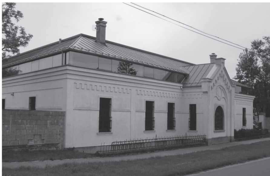
A sárosfai kastély