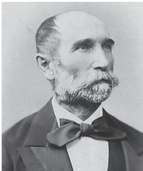
Bittó István, Magyarország országgyűlési képviselője, a képviselőház alelnöke és elnöke, igazságügyi miniszter és miniszterelnök