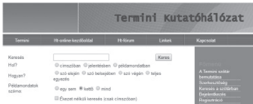
3. ábra. A Termini szótár nyitóoldala

Keressetek rá az interneten a http://termini.nyud.hu/htonline oldalra! Olvassátok el a szótár nyitóoldalán és a főmenüjében található ismertetéseket! Beszélgetsetek el a szótár céljáról és felépítéséről!