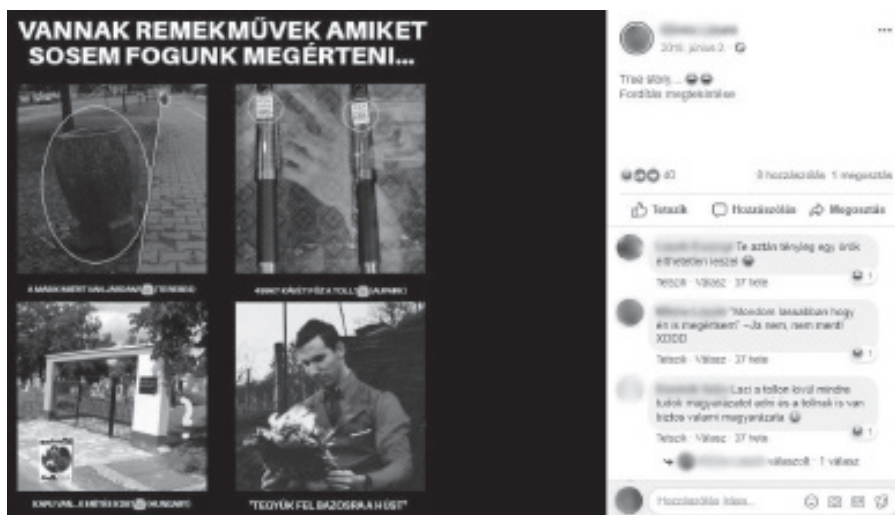
2. ábra. Kölcsönem a képi kommunikációban (l. kapu van...kerítés kde? )