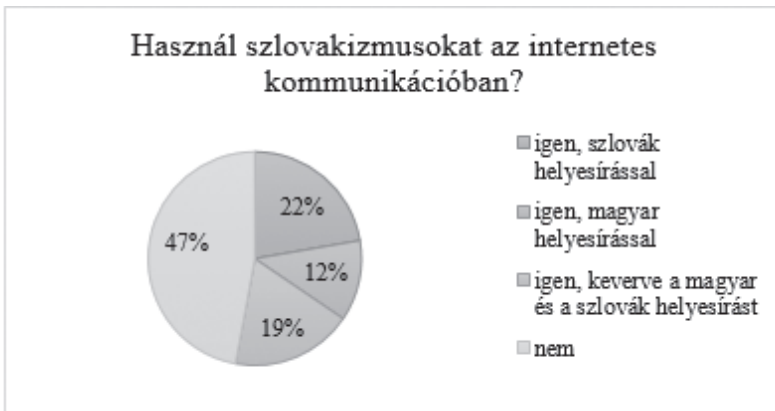
1. ábra. A szlovakizmusok internetes kommunikációbeli használata (Istók–Szerdi 2016, 70)

Egy Istók Bélával közösen végzett felmérésünkben rákérdeztünk a szlovakizmusok internetes kommunikációban való használatára a helyesírás szempontjából (Istók–Szerdi 2016a, 70). A megkérdezettek 52,92%-a igenlő, 47,08%-a pedig nemleges választ adott. A szlovakizmusokat használók 42,11%-a a szlovák ( tepláky, párky, horčica ), 23,06%-a a magyar helyesírást ( tyepláki, párki, horcsica ) követi, a maradék 34,83% pedig egyveleges szóalakokat ( spekacsky; špekački; obcsánszky ) hoz létre az interneten (Istók–Szerdi 2016, 70; 1. ábra).