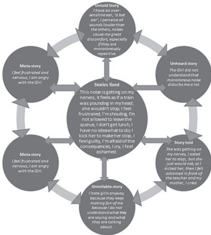
Figure 1: Telling stories

Pearce and Cronen hold that the stories differ in a certain communication situation, and even considerable tension may occur among them.