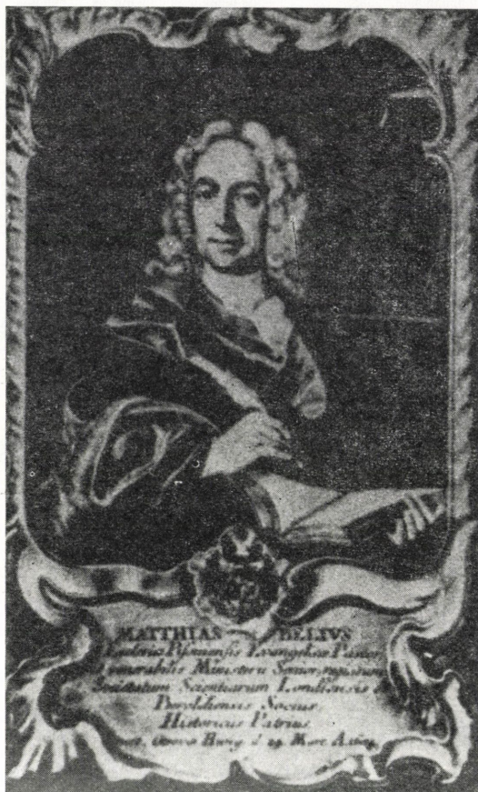
1. kép Bél Mátyás (1684—1749)

gyar fordítását tette közzé a Vasi Szemle, és a Pest megyei rész is napvilágot látott. Időközben Soós Imre fordításában külön kötetben jelent meg — sajnos nem szözszerinti fordításban, hanem kisebb kihagyásokkal, hasonlóan a vasi közleményhez — Heves megye leírása. 7