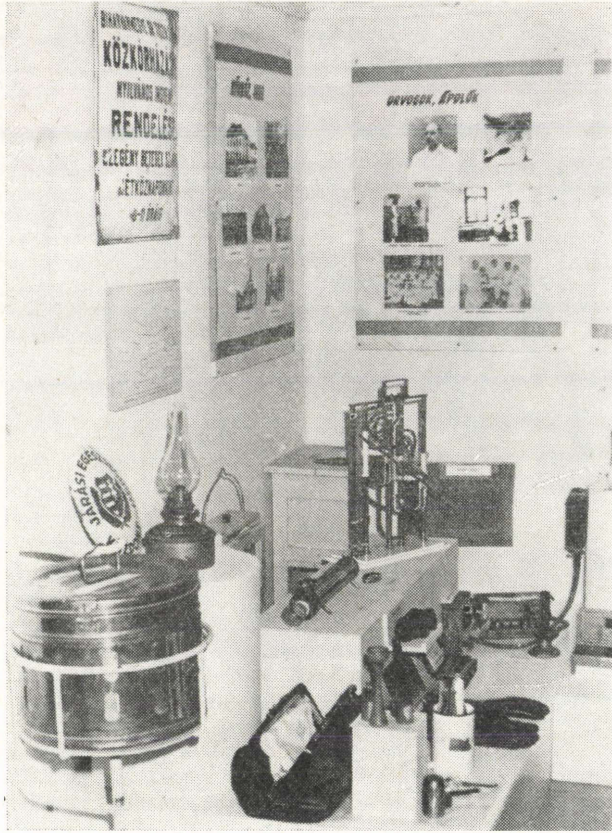
4. kép: A kórháztörténeti állandó kiállítás részlete

A IV. Megyei Honismereti Úttörőtábor kiállítása