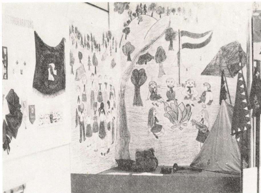
5. kép: Részlet az úttörőtörténeti kiállításról.