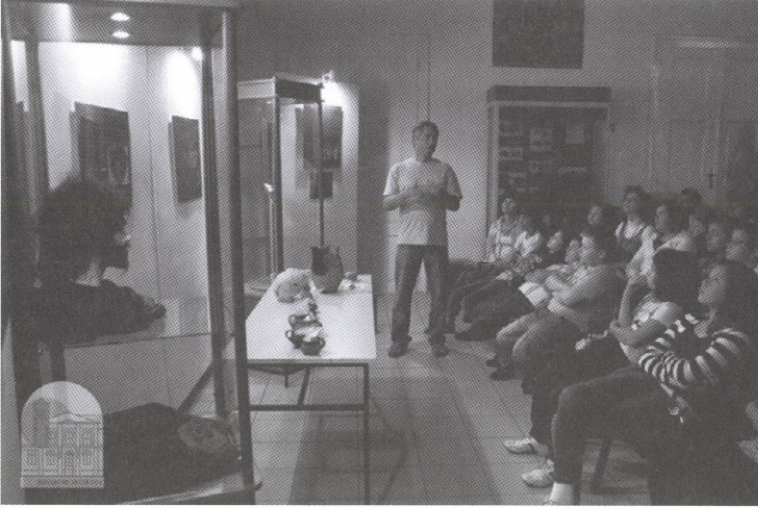
Kutatók Éjszakája 2010