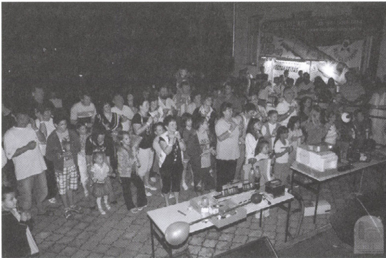
Fényorgona megszóltatása (Múzeumok Éjszakája 2010)