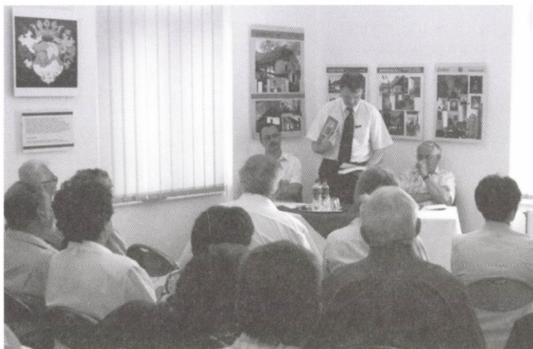
A Bihari Múzeum Évkönyve XII–XIV. és a Bihari tájházak és kiállítóhelyek I. kötetek bemutatója