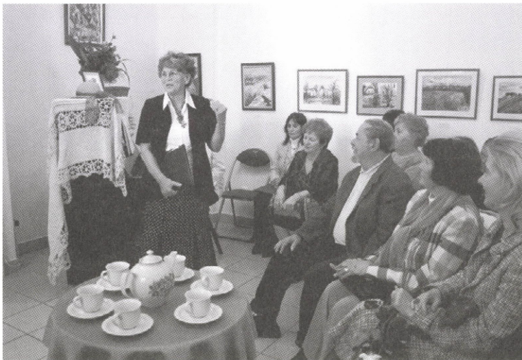
Művészetek találkozósa – teadélután (Múzeumok Őszi Fesztiválja 2010)