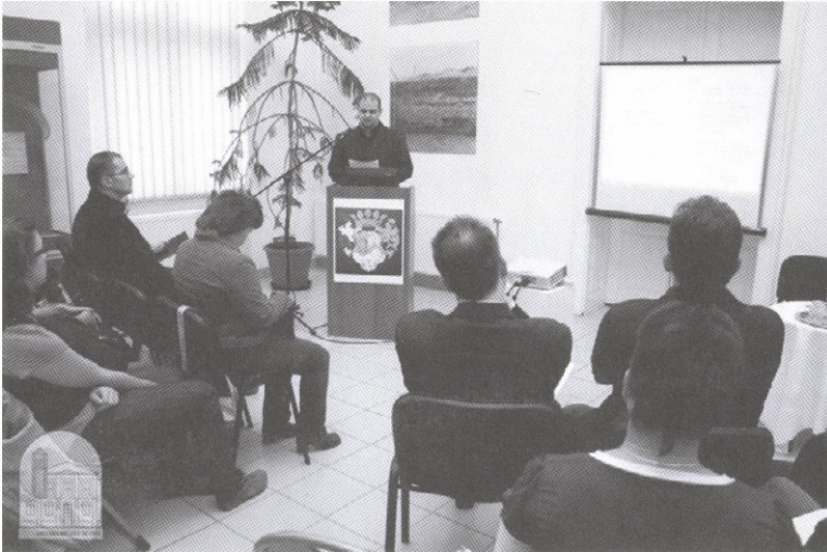
A „Trianontól a II. világháború végéig” szakmai konferencia