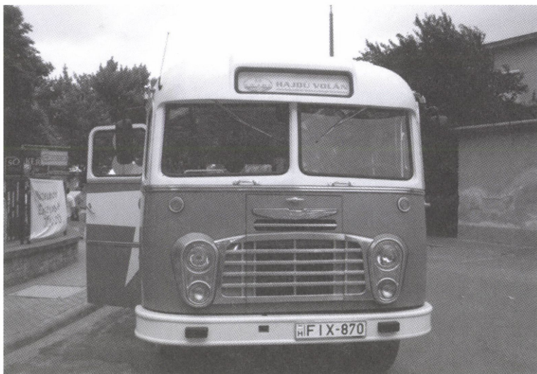
Városnéző retróbusz 1979-ből (Múzeumok Éjszakája 2009)