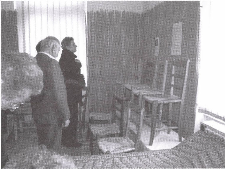
Látogatók a Székfaragó mesterek az Érmellékről c. időszaki kiállításban