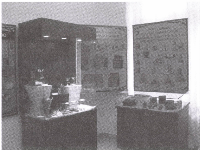
Részlet a Hideg nyalat és spanyol tekercs – A fagyalt, a jégkrém és a parfé története c. időszaki kiállításból