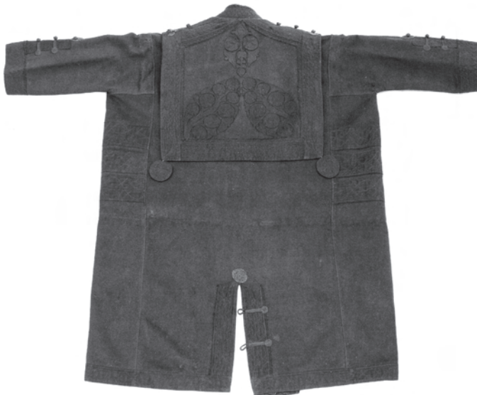
2. kép. A BM I.76.12. leltári számú toldócsík nélküli ünnepi szűr hátulja, a galléron a jellegzetes bihari dohánylevél formájú rátétes díszítéssel