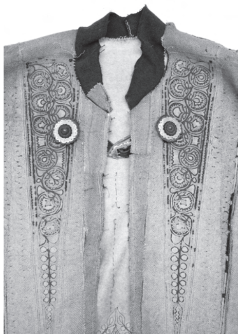
1. kép. Szegfűk a BM. I.2001.19. leltári számú szűr elején