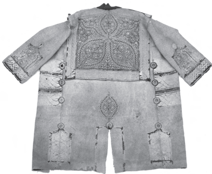
2. kép. A BM I.2001.19. leltári számú toldócsík nélküli szűr hátulja, a gallér teljes felületét kitöltik a minták