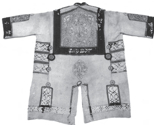
2. kép. A BM I.74.3.1. leltári számú toldócsikkal, borítással ellátott váradi szűr hátulja, gallérja címermotívummal