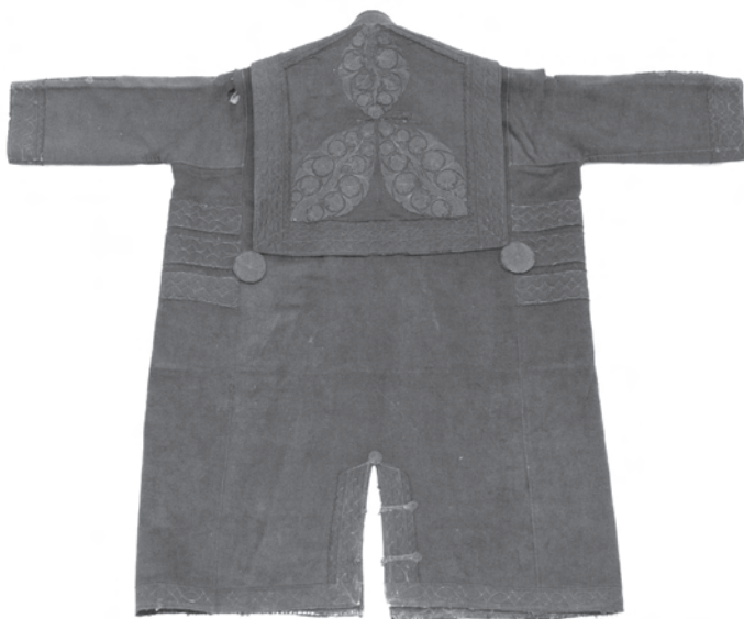
2. kép. A BM I.2001.16. leltári számú toldócsík nélküli szűr hátulja; a gallér díszítménye a szintén jellemzően bihari applikált rátét díszítmény