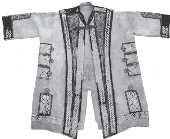
1. kép. A BM I.74.3.1. leltári számú toldócsikkal, borítással ellátott váradi szűr eleje, nyak és szecc megoldása címerekkel