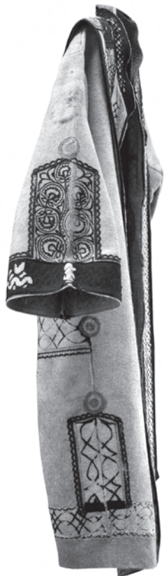
1. kép. A BM. I.74.3.1. leltári számú váradi szűr oldalának és ujjának díszítménye, kokárda-szerű galambkosarakkal