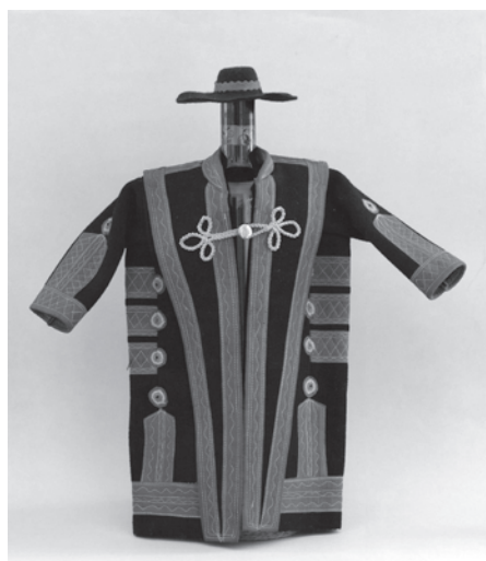
2–3. kép. Üvegöltöttető kicsi szűrök a Bihari Múzeum gyűjteményében