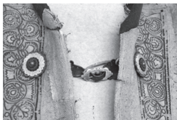
2. kép. A BM. I.2001.19. leltári számú szűr szaruból készült csatja