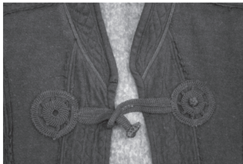
2. kép A BM I.76.12. leltári számú ünnepi szűr megkötője