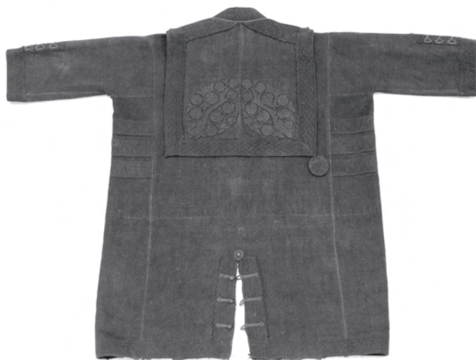
2. kép. A BM I.2001.17. leltári számú toldócsík nélküli szűr hátulja, gallérján dohánylevél formákkal. A felső minta hiányzik