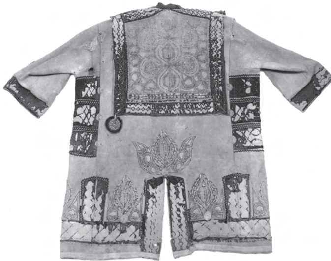
2. kép. A BM I.2001.15. leltári számú toldócsíkkal, borítással ellátott szűr hátulja szokatlanul sok címermotívummal