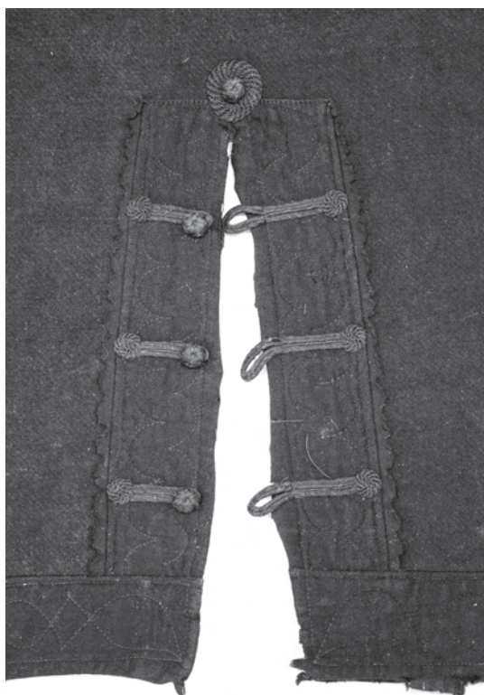
3. kép. A BM. I.2001.17. leltári számú szűr alja, ahol a felhasítás gombolása nem csak dísz, hanem használható is