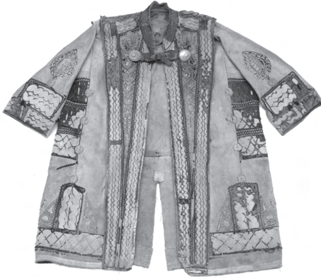
1. kép. A BM I.2001.15. leltári számú toldócsíkkal, borítással ellátott szűr eleje, címer mintákkal