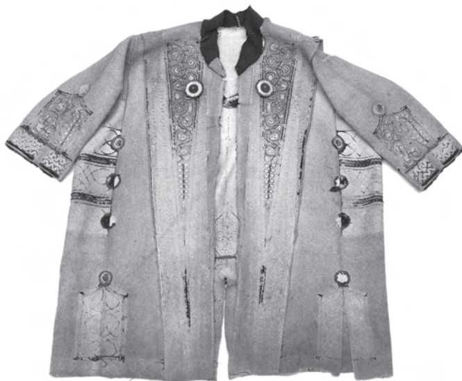
1. kép. A BM I.2001.19. leltári számú toldócsík nélküli szűr eleje, ritka szürszi-j-megoldással