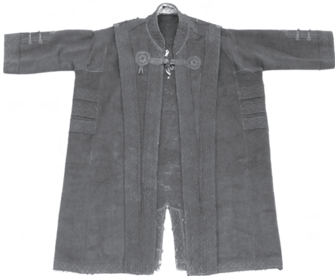
1. kép. A BM I.2001.16. leltári számú toldócsík nélküli szűr, szintén horgolt átkötő rész helyettesíti a szürszíjat