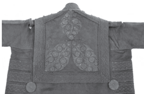
3. kép. A BM I.2001.16. leltári számú szűr gallérja, három dohánylevél formával, amelyben leveles virágos indás applikált minták találhatóak