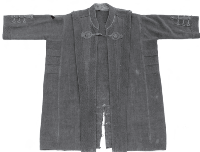
1. kép. A BM I.2001.17. leltári számú toldócsík nélküli szűr eleje, a szeccen átkötővel, az ujjakon horgolt gombokkal, gombházakkal