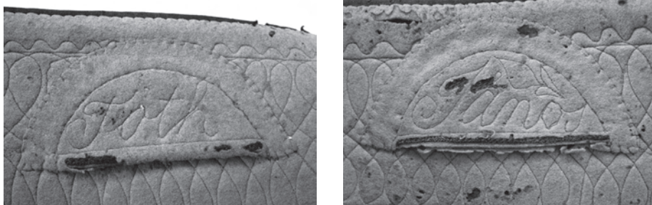
1–2. kép. Névjelölés a BM. I.2001.16. leltári számú ünnepi szűr belsejében