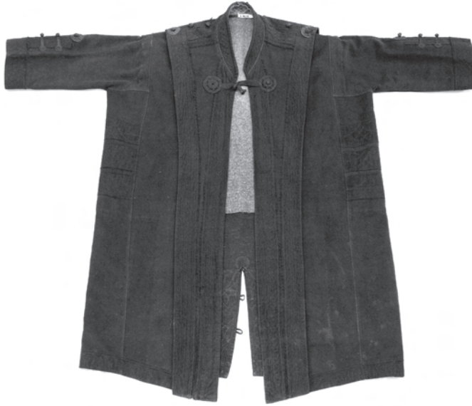
1. kép. A BM I.76.12. leltári számú toldócsík nélküli ünnepi szűr eleje szűrszík helyett gombkötő horgolta átkötővel