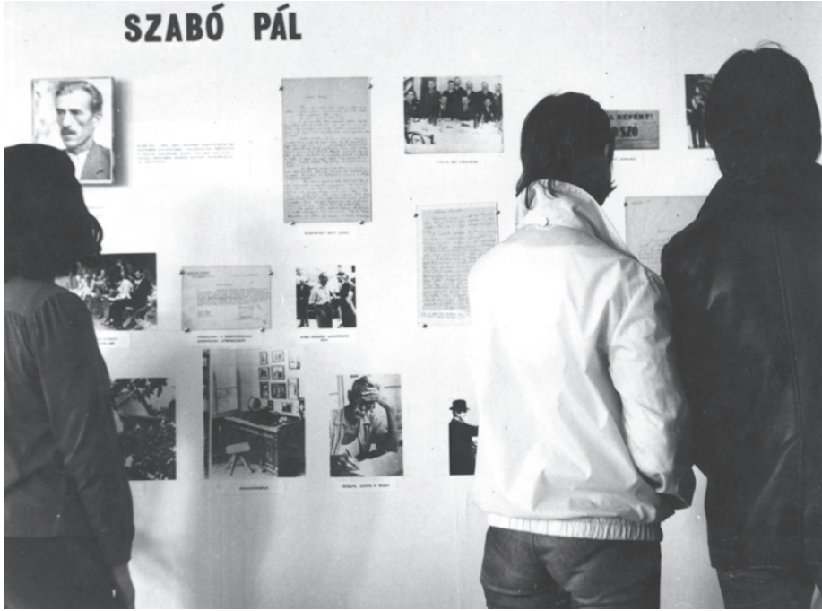
3. kép. Szabó Pál-kiállítás a Bihari Múzeumban