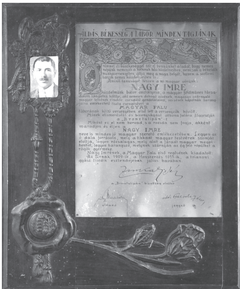
1. kép. Nagy Imre bronztulipánja

Az első irodalmi sikert is a Magyar Falunak köszönhette. 1929. július 27-én, a sárrétudvari községházán vehette át ünnepélyes keretek között a Magyar Falu költői versenyének díját, a versírás bronztulipánját (1. kép). Egy évvel később Sinka István is megkapta ezt a díjat. Mindez azonban kevés volt ahhoz, hogy irodalmi rangot nyerjen költészetük.