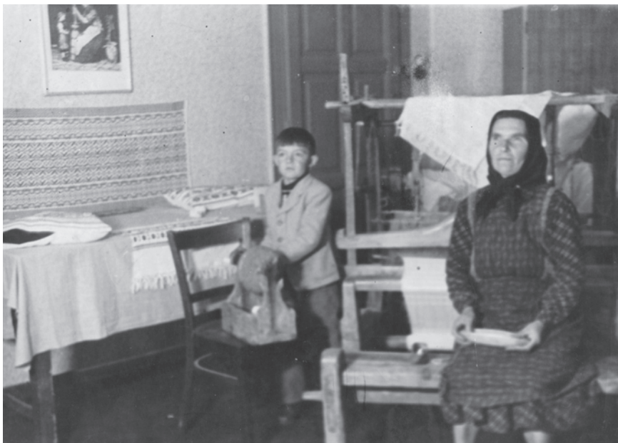
6. kép. Szövőszakkör a művelődési házban

dolgoztak egy ideig, de ez az üzleti vállalkozás – mivel a munkaigényes darabokat nem fizették meg kellőképpen – nem volt hosszú életű.