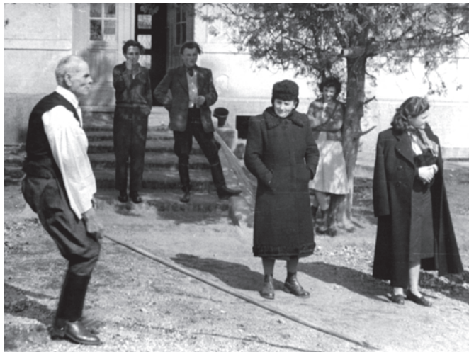
4. kép. Táncfelvétel a művelődési ház udvarán