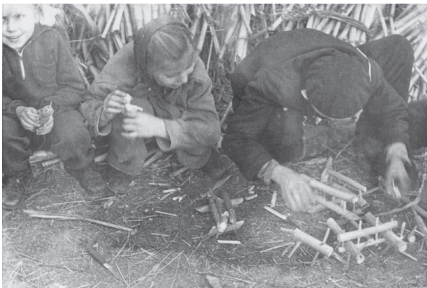
9. kép. Kórójáték-készítés