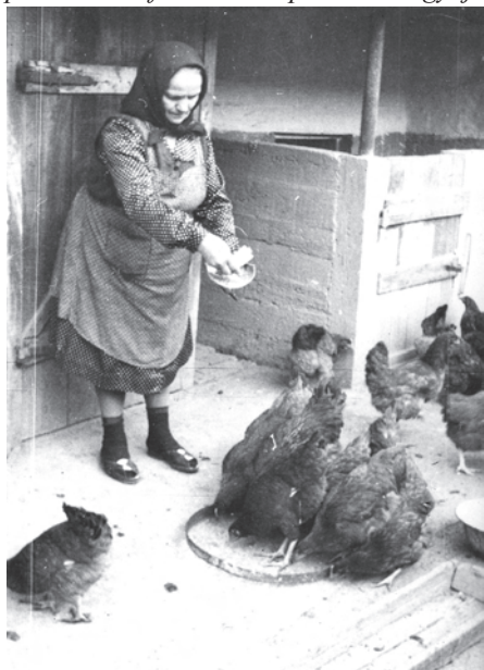
10. kép. A Luca-napi abroncsból etetés szokása

Ez a monográfia ismerteti a községben – 1979-ben városi rangra emelkedett Berettyóújfalu! – élő néphit, népi hitvilág valamennyi területét, az azonos típusú anyagokat párhuzamba állítja (pl. rontás, gyógyítás). A népi hit-életének a múlt század végétől napjainkig terjedő időszakát öleli fel: a visszaemlékezéseket, a közelmúlt gyakorlatát és a jelenben is élő, aktívan gyakorolt eljárásokat: a megrontott, szemmel megvert gyermek gyógyítását, a kígyóhagyma termesztését, a nem tojó tyúk létra fokán való átbujtatását, az abroncsban való etetést (9. kép), a hízó megseprűzését, a csak virágzó, de nem termő fa, uborka ostorozását stb.-t. Ezekről fényképek is készültek, realizálva a leírtakat. (Nagy részük a M.T.A Néprajzi Kutatócsoportjának adattárában található, itt csak néhányat mellékelek. (Gyűjtésem során láttam a „csuportevést”, azt, hogy miképpen kell a beteg (gyermek) fájó hasára vagy hátára a gyógyító csuport elhelyezni: rongy égetésével a csuport alatt a levegő megritkul, az edény/csuport vagy pohár a bőr felületére tapad és oda gyűjti a vért. (Ez a vér gyógyít!)