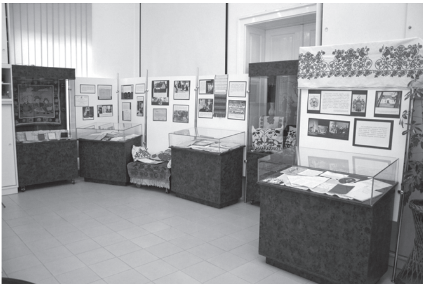
13. kép. A Bihari Múzeum emlékkiállítás