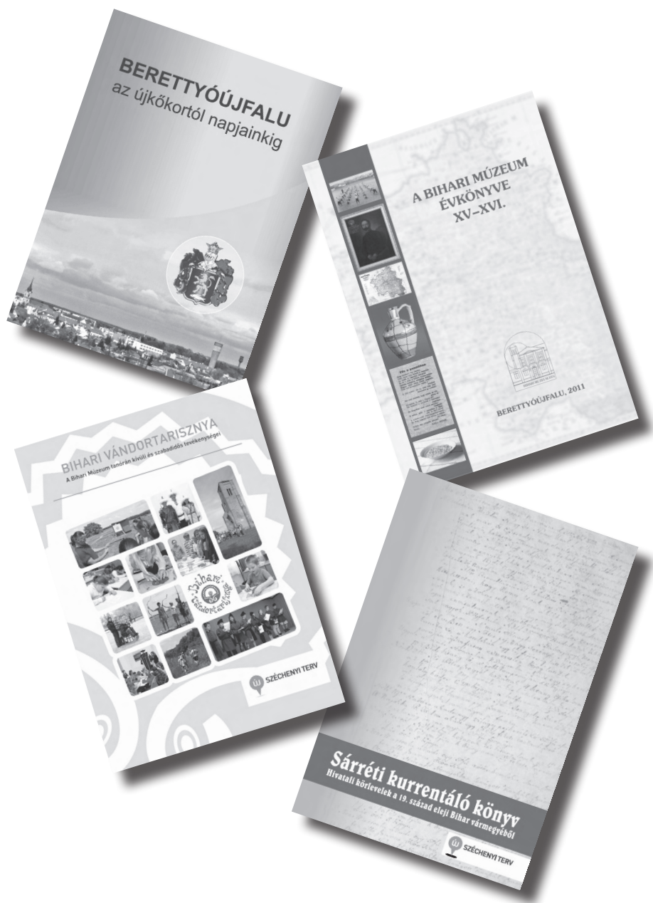
11.kép. Legújabb kiadványaink