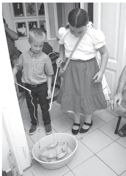
35–37. kép. 2013-ban az Éjszaka témája a vízvilág egykori és mai állapota volt