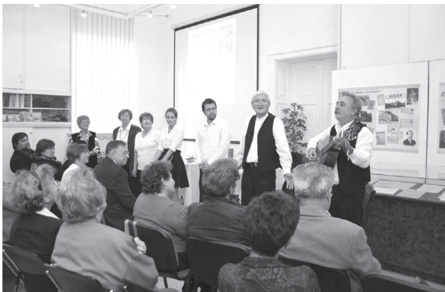
41. kép. A Múzeumok Őszi Fesztiváljára is érdekes irodalmi-zenés programokkal vártuk 2012-ben az érdeklődőket