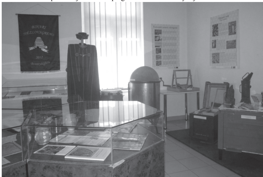
15. kép. A bihari méhészetet bemutató tárlat 2012. június 23-án, a Múzeumok Éjszakáján nyílt meg és október közepéig várta a látogatókat