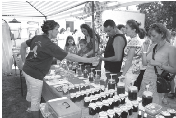
32–34. kép. A 2012-es Múzeumok Éjszakáján minden a méz körül pergett