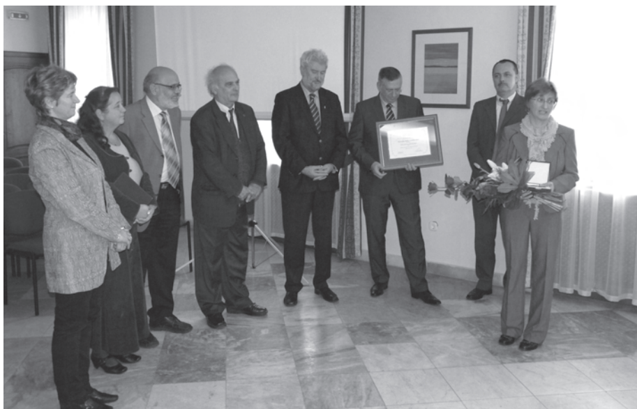
5. kép. Az emlékérem átadásán 2012. november 7-én, Nagykanizsán, a Pulszky Társaság Kismúzeumi Tagozati ülésén