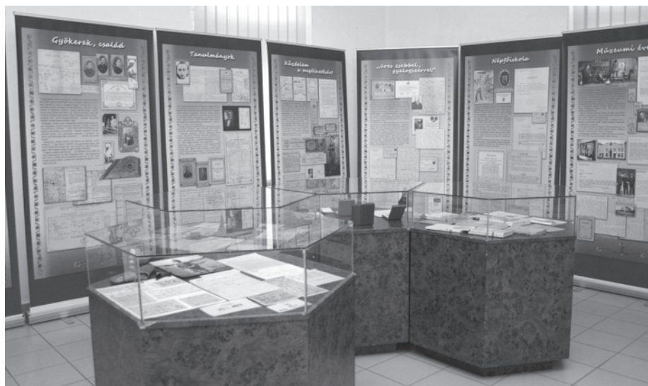
16. kép. A Háromföld krónikását, Szücs Sándort mutatta be 2013 nyarán egy vándorkiállítás