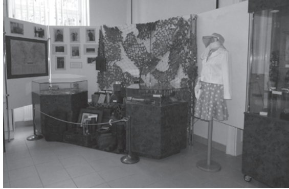
19. kép. Rendhagyó kiállításokat rendeztünk az előadóteremben is. 2013-ban középiskolás diákok mutatkozhattak be alkotásaikkal és gyűjteményeikkel az őszi fesztivál keretében