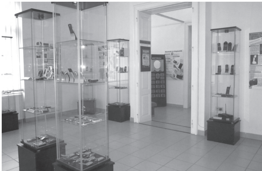
14. kép. A Mobil-kor-történet című vándorkiállítás 2012-ben áprilistól június közepéig volt látható Berettyóújfaluban