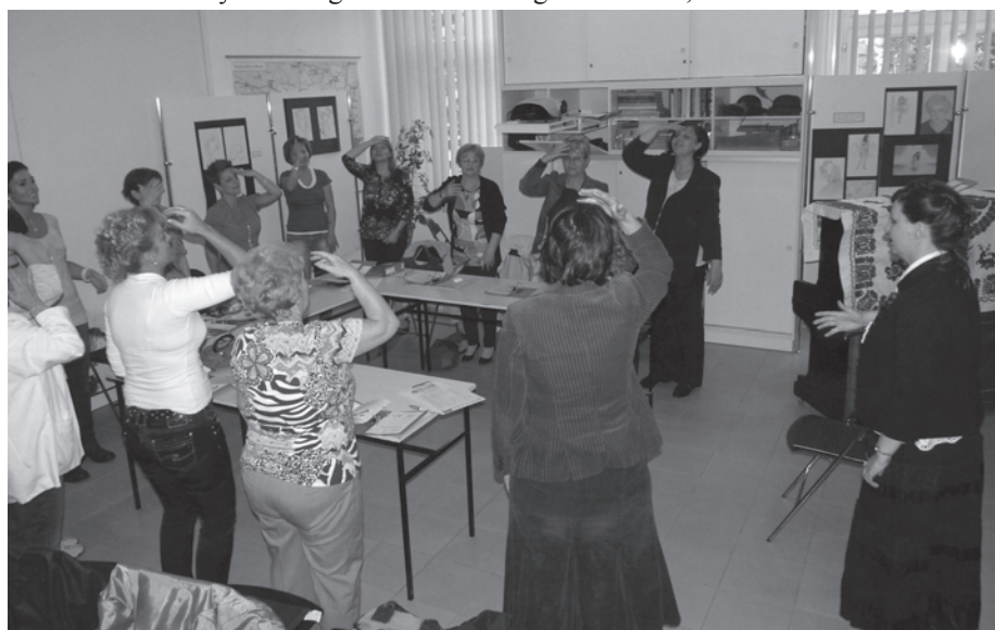
10. kép. ... és 2013-ban az Múzeumok Őszi Fesztiválján, az Énektanárok éjszakája programon