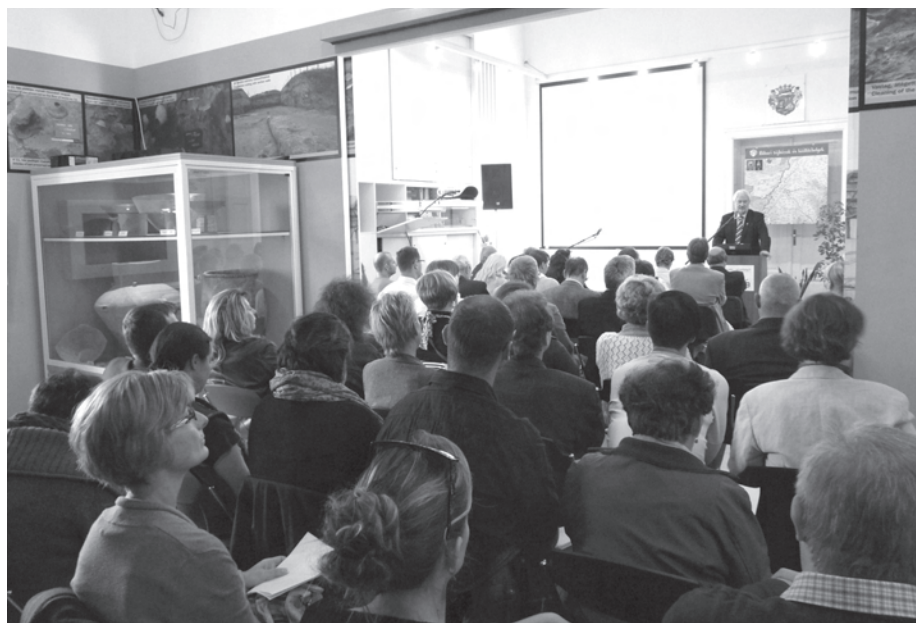
9. kép. Használatban az új előadóterem a Pulszky Társaság Kismúzeumi Tagozati ülésén, 2012 őszén ...