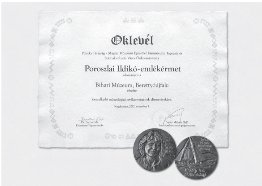
4. kép. A Poroszlai Ildikó-emlékérem és oklevél