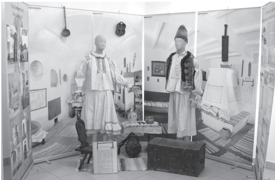
12. kép. A megyei levéltár vándorkiállítása a Bihari Múzeumban 2011. május 31-én nyílt meg