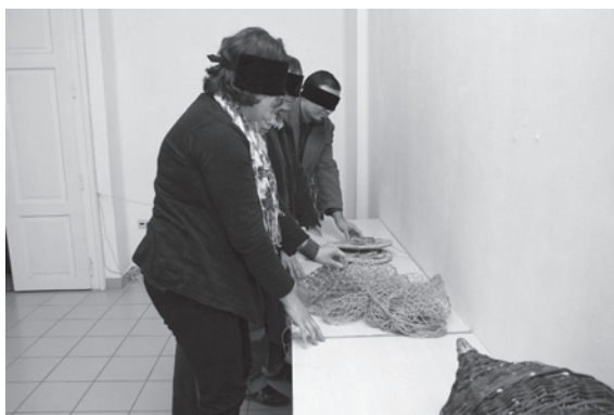
18. kép. „Mindent a kéznek, semmit a szemnek!” című tapintható tárlatunkat a megyében dolgozó muzeológus kollégáknak is bemutattuk vak emberek tárlatvezetésével egy szakmai nap keretében