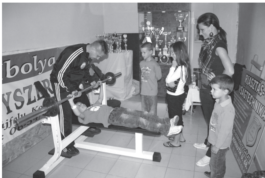
30–31. kép. A Múzeumok Éjszakája programunk központi témája 2011-ben a sport volt