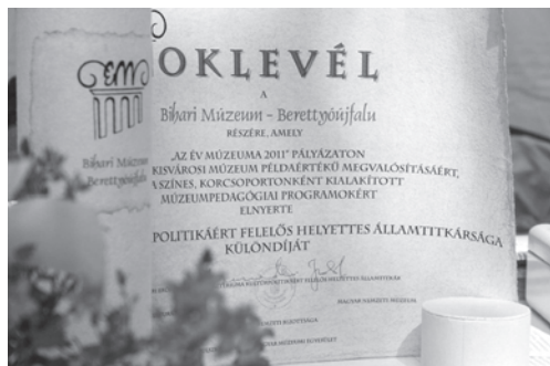
1. kép. „Az év múzeuma, 2011” pályázat elismerő oklevele a minisztériumi különdíjról