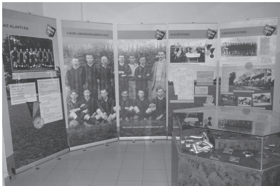
13. kép. Hajrá, BUSE! –100 éves a Berettyóújfalui Sport Egyesület című időszaki kiállítás 2011. június 24 – 2012. január 15-ig volt látható