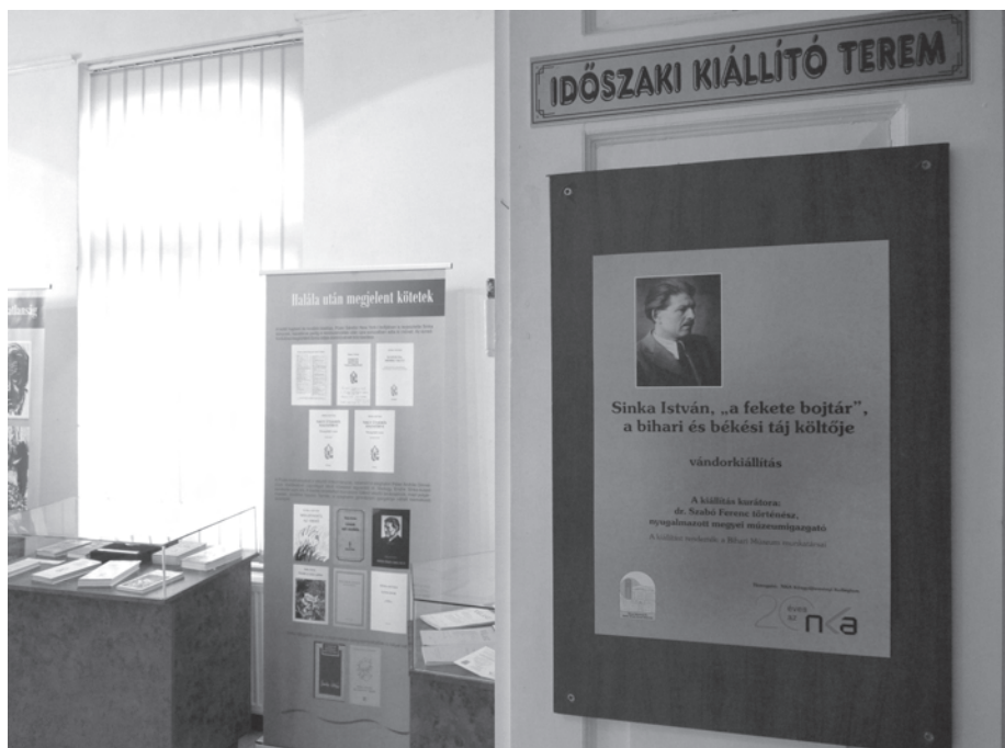
17. kép. Sinka Istvánra, „a fekete bojtárra”, a bihari, békési táj költőjére 2013 őszén emlékezett az intézmény