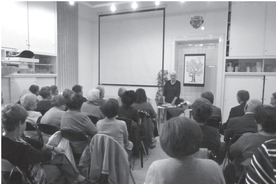
44. kép. A Bihari Diéta IX. tudományos ülésén 2013. november 11-én, Márton-napon Berettyószentmárton volt a téma