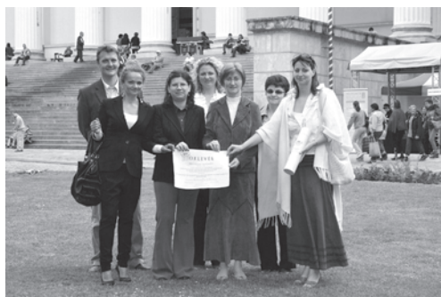
3. kép. A berettyóújfalui delegáció csoportképe a díjkiosztó után a 2012. május 19.