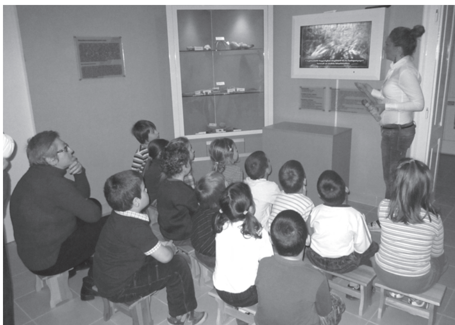
6–8. kép. Az EU-s pályázatból megújult interaktív régészeti kiállítás (Átadás éve: 2011)