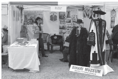
2. kép. A Bihar Múzeum sátra a Magyar Nemzeti Múzeum kertjében, a Múzeumok Majálisa