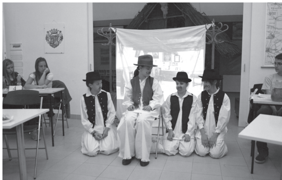
38–39. kép. Általános és középiskolás diákok számára is szerveztünk helytörténeti vetélkedőket például 2013-ban is