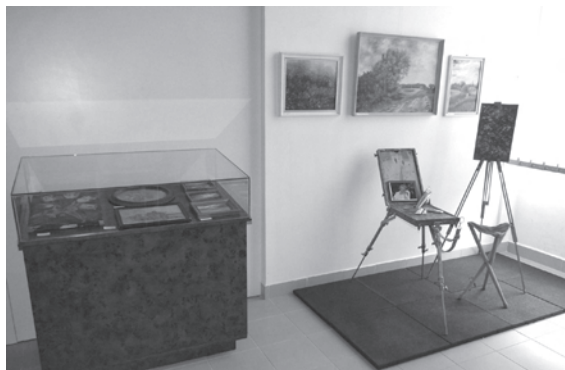
21. kép. A 100 éve született Soltész Kálmánné festőre is az előadóteremben emlékeztünk egy kis kiállítással 2012 májusában