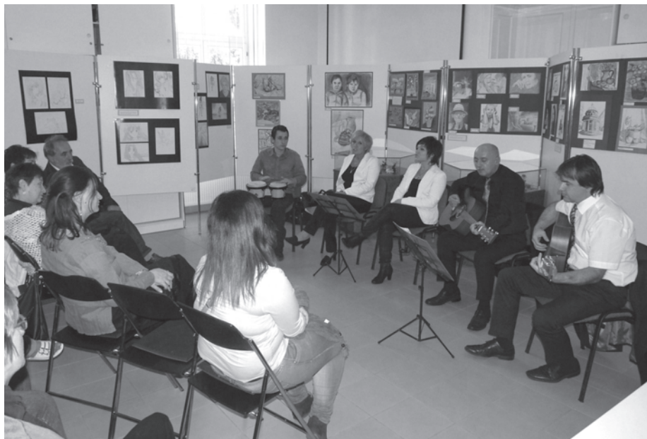
42. kép. A vésztői Vejsze együttes megzenésített Sinka-verseket adott elő a 2013-as őszi fesztivál egyik eseményén