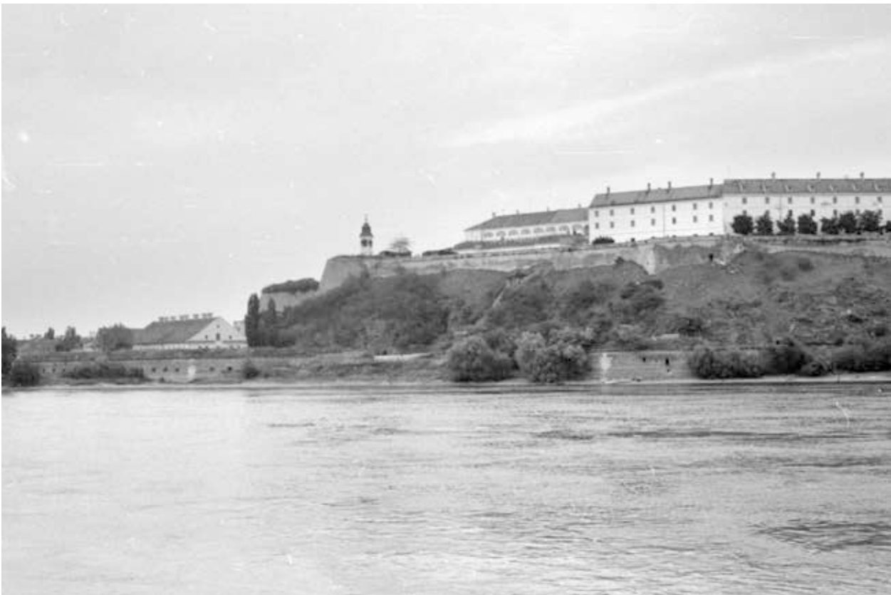
34. kép. Délvidék, Pétervárad, 1977 (Gy. N. 858/9.34.)