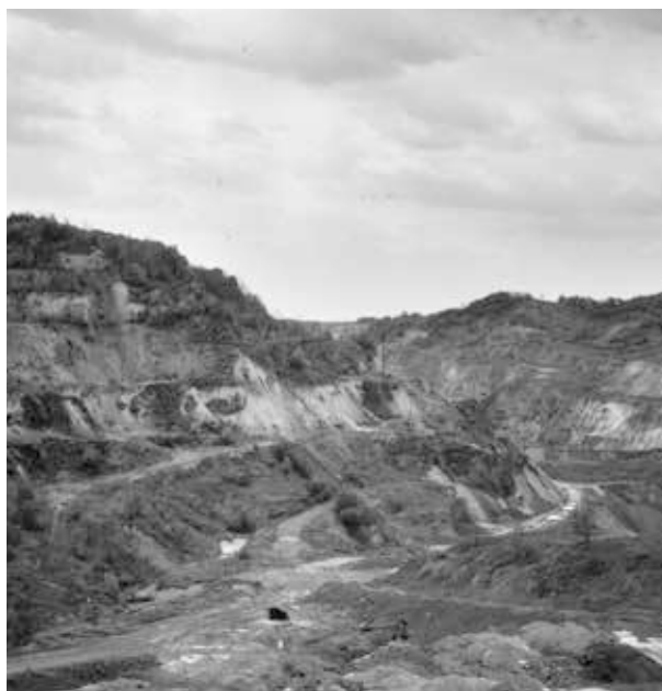
1. kép. A rudabányai ősemberlelet környéke (GY. N. 904/8.)