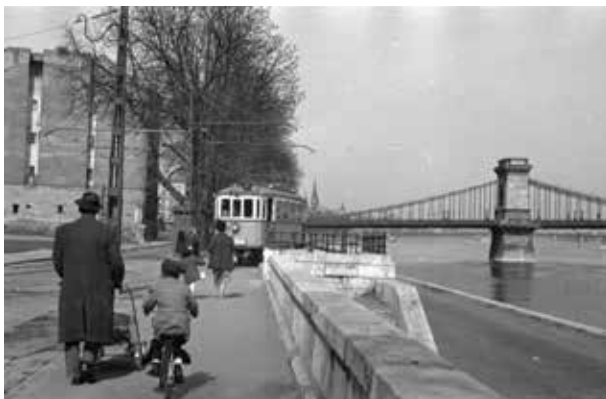
16. kép. Budapest (Gy. N. 881/81.28.)