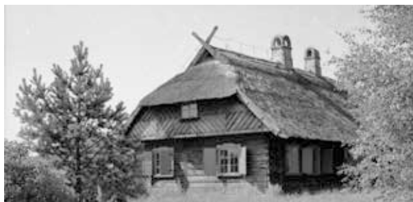
24. kép. Sanok, Skanzen (Gy. N. 858/2.22.)