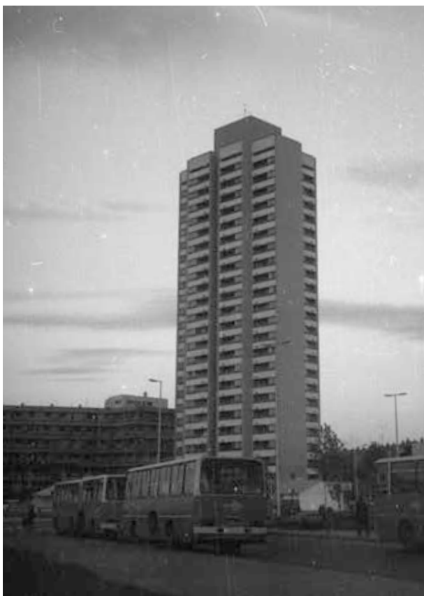
26. kép. Szolnok, toronyház (Gy. N. 896/7.)