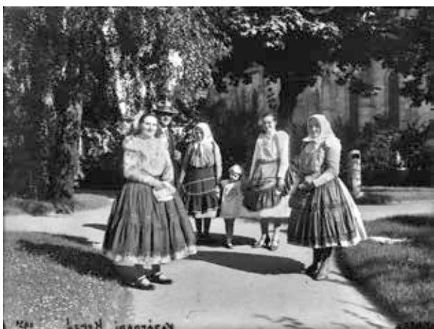
6. kép. Kassa, vasárnapi korzó népviseletben (Gy. N. 871/1.)