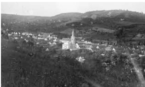
3. kép. Szekszárd, városkép (Gy. N. 876/6.)