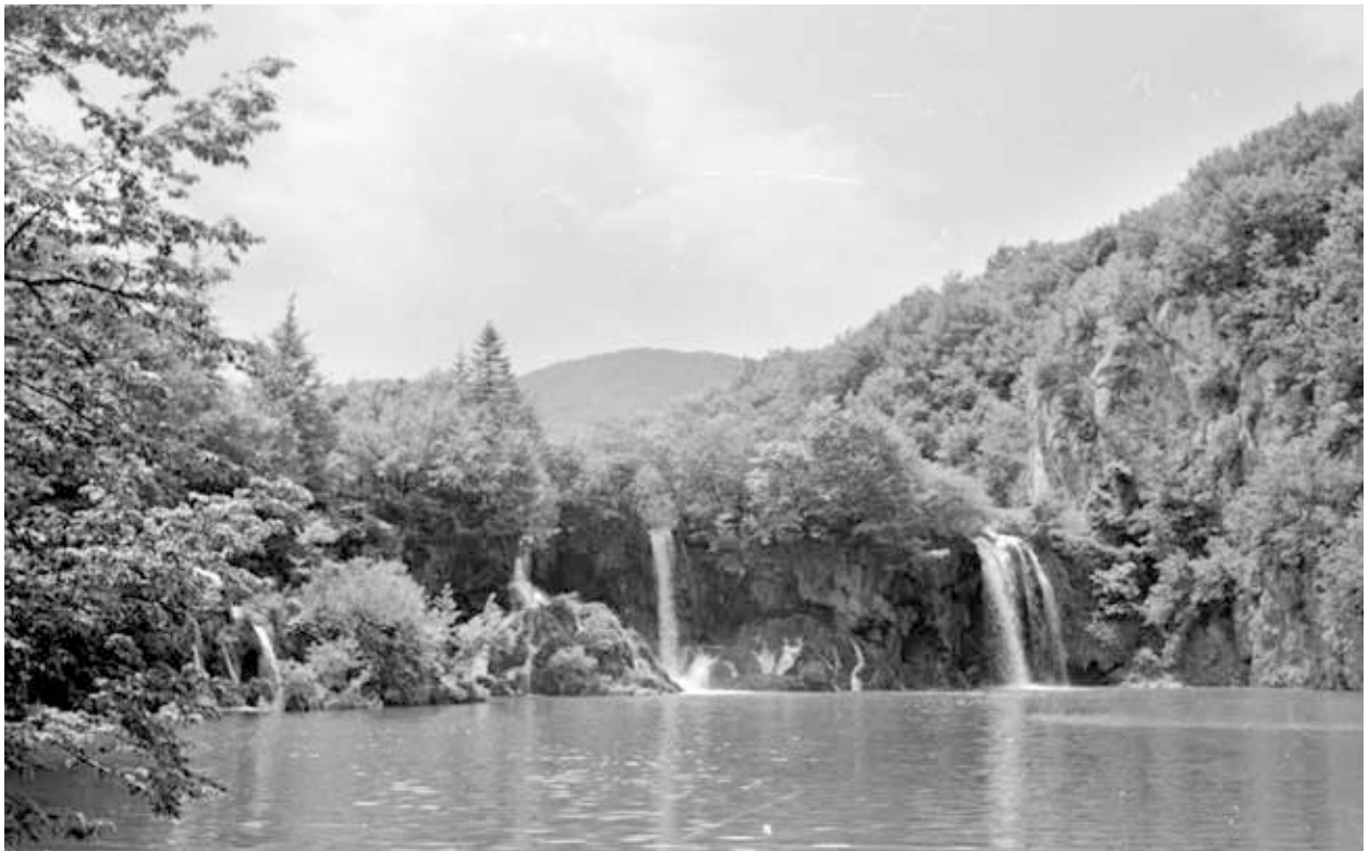
31. kép. Jugoszlávia, Plitvicei Nemzeti Park (Gy. N. 858/17.17.)