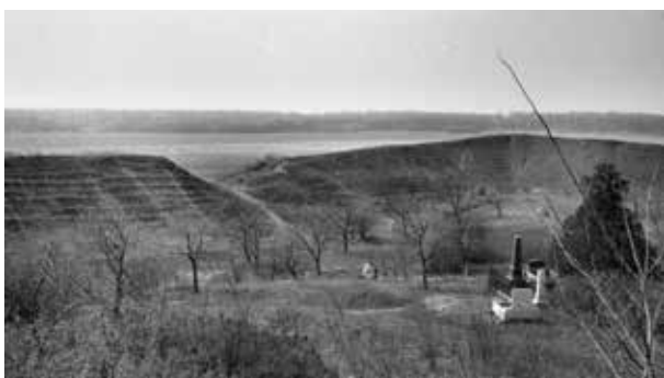
17. kép. Szabolcs, Földvár (Gy. N. 881/16.22.)