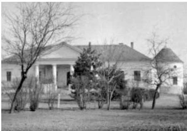
20. kép. Nagykereki, Bocskai-várkastély (Gy. N. 901/6.)