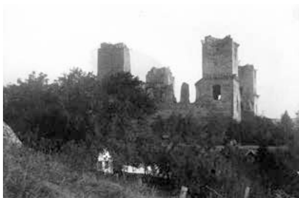
7. kép. Diósgyőri vár (Gy. N. 874/11.)

Felvidék: Kassa–Sztracena-völgy–Krasznahorka–Tátra-Lomnic–Csorba-tó: 9 db síkfilm, 9 db 6x9 cm-es üveglemez (GY. N. 878/17–33.) (9. kép)