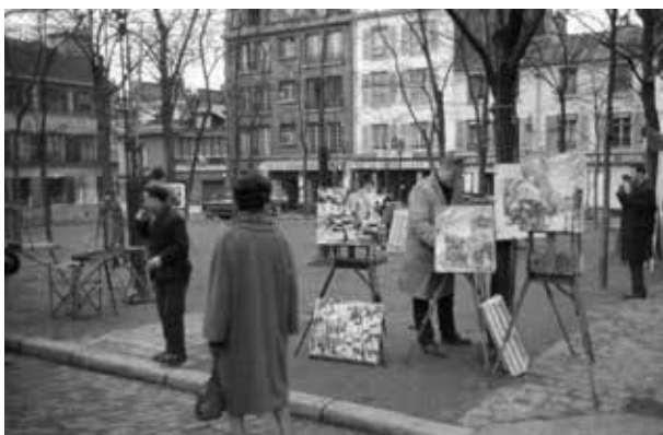
19. kép. Párizs (Gy. N. 858/31.3.)

megettévesztés! Csak amikor a képüket felismertük, akkor kezdtünk gyanakodni valami aljas trükkre.