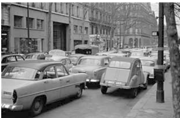
18. kép. Párizs, társasutazás (Gy. N. 858/33.17.)