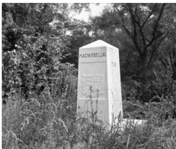
25. kép. Magyar–román–szovjet határkő (Gy. N. 895/10.)