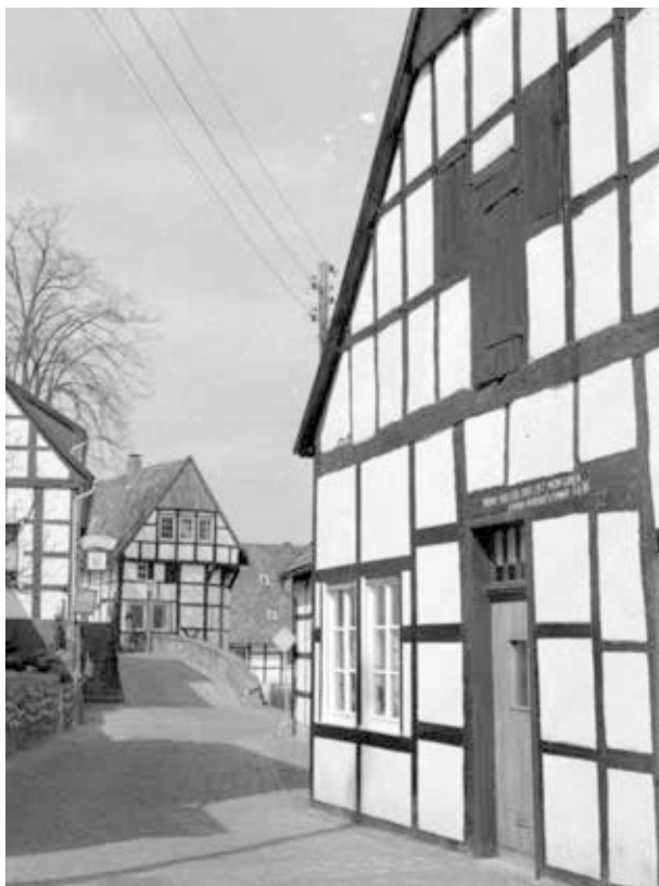
27. kép. NSZK, Tecklenburg, 1979 (Gy. N. 858/48.18.)

Zemplén, László-tanya–Sárospatak: 2 kocka 6x6 cm-es fekete-fehér rollfilmből (Gy. N. 895/12) és 1 kocka 6x6 cm-es színes rollfilmből (Gy. N. 897/10.)