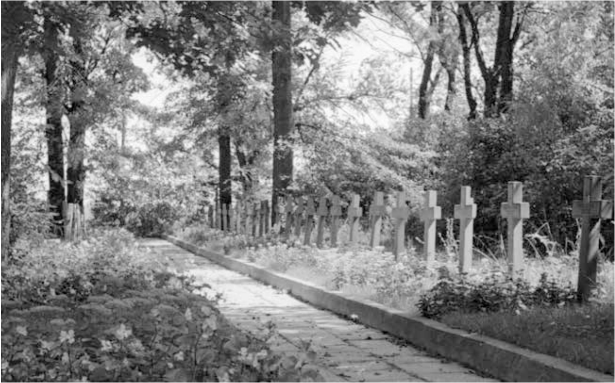
33. kép. Lengyelország, Lukow, I. világháborús hősi temető, 1975 (Gy. N. 858/2.16.)