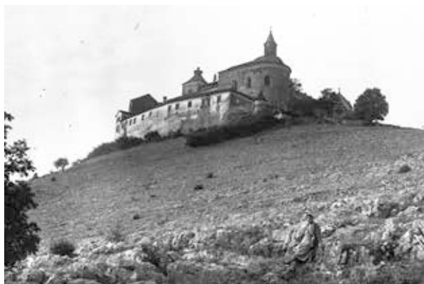
9. kép. Krasznahorka vára (Gy. N. 878/26.)