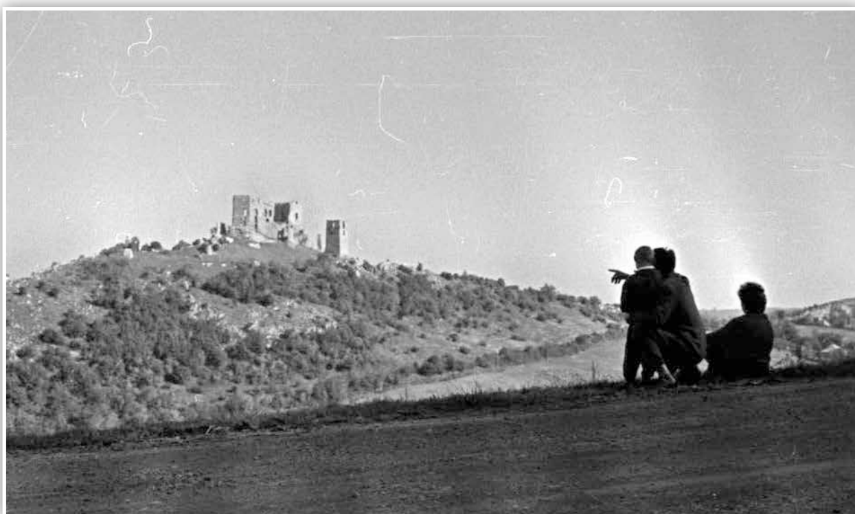
A cseszneki vár