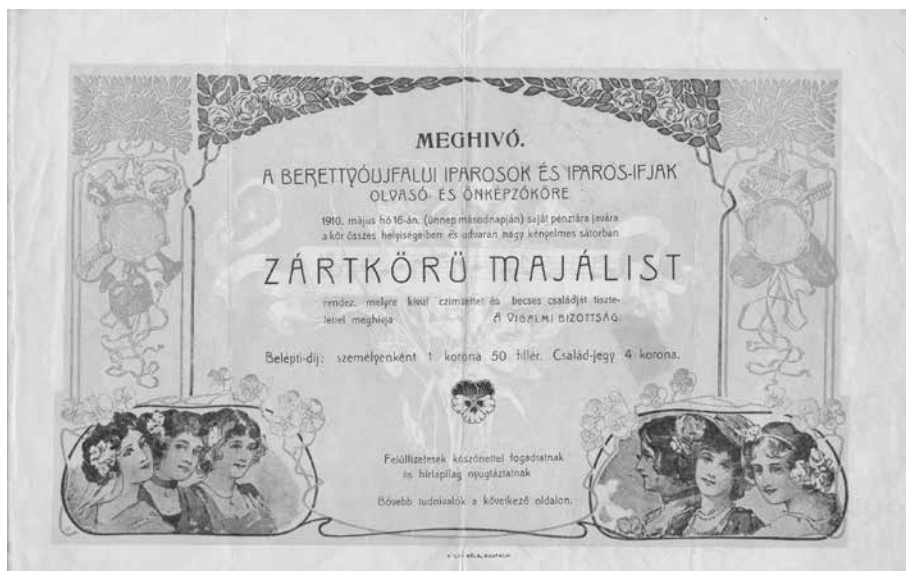
1. kép. Meghívó a Berettyóújfalui Iparosok és Iparos Ifjak Olvasó- és Önképző Körének zárt körű majálisára (Bihari Múzeum gyűjteménye, leltári szám: BM. IV.89.23.2.)