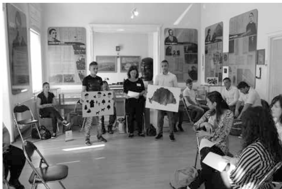
9. kép. Vetélkedő a Holnap c. irodalmi antológia költőiről a nagyvárad Ady Múzeumban