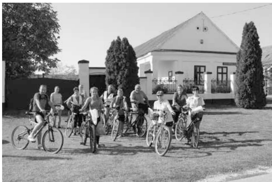
11. kép. Kerékpártúra a Múzeumok Őszi Fesztiválja keretében, 2018