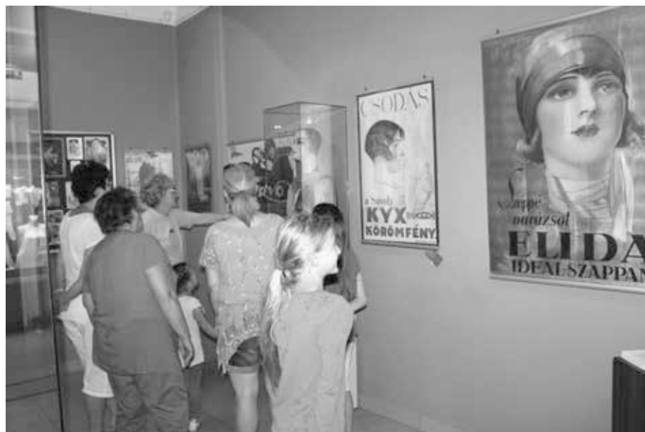
5. kép. Családi múzeumi délután A szépség és a reklám c. kiállításban 2018