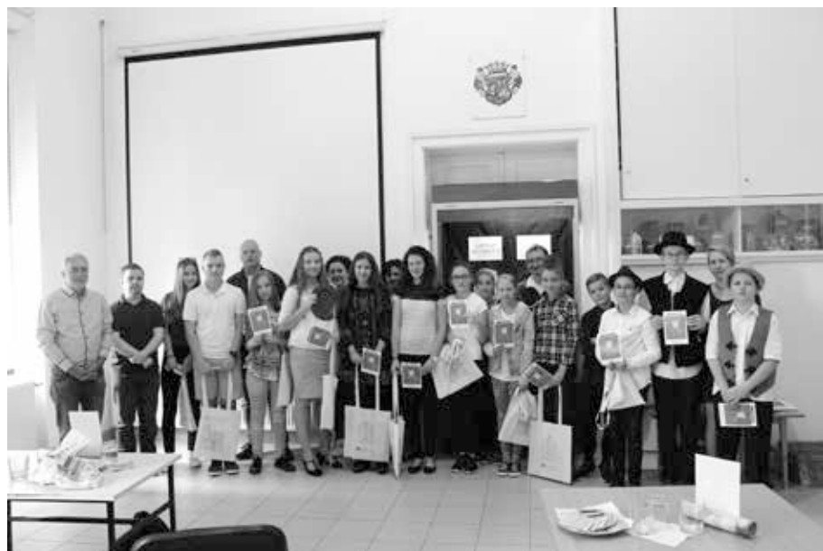
8. kép. Az általános iskolás vetélkedő résztvevői, 2018