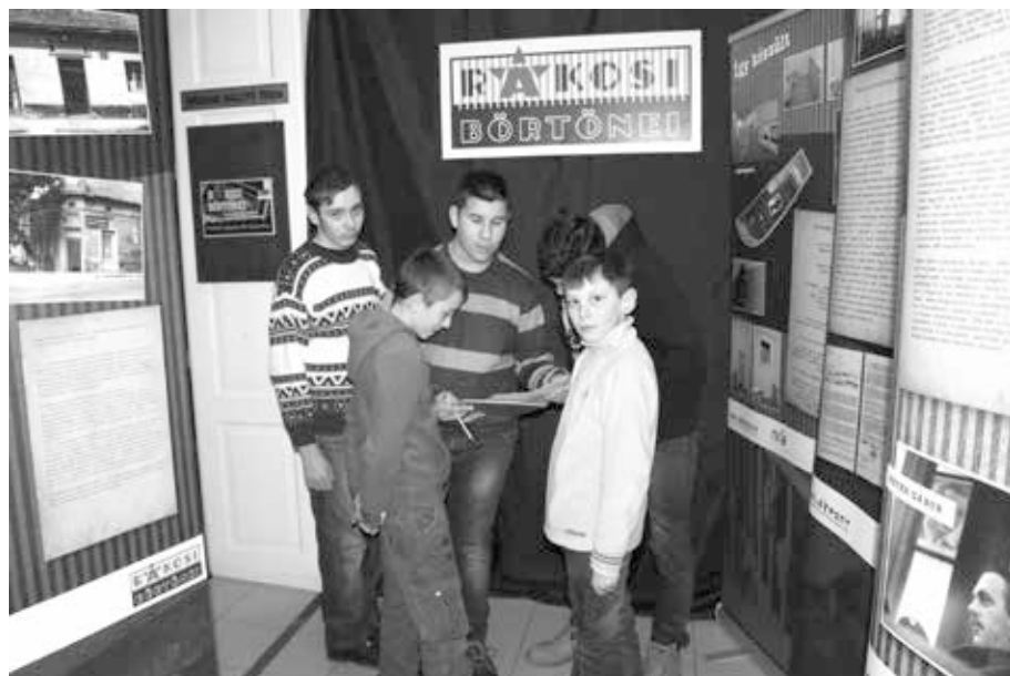
4. kép. „Nyomozós” családi délután a Rákosi börtönei c. kiállításban