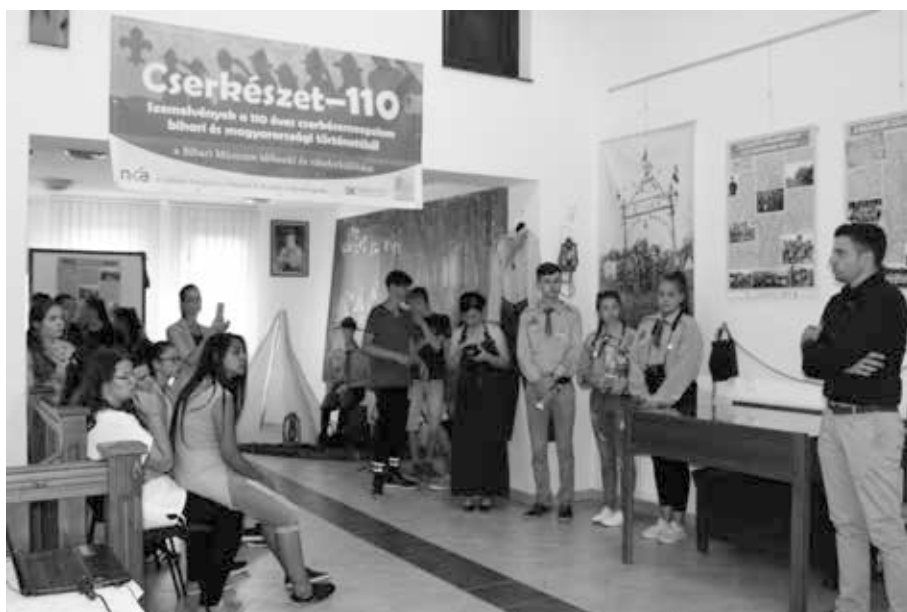
7. kép. Cserkészzet 110 – Szemelvények a 110 éves cserkészmozgalom történetéből c. vándorkiállítás megnyitója Létavértesen, a Rozsnyai Gyűjteményben 2018. május 11-én