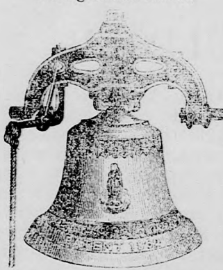
Fakorona régiebb szerkezeti