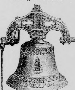
Szabadalmazott öntött vas-sisak legújabb szerkezettű