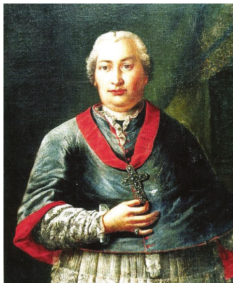
Barkóczy Ferenc portréja 46

Barkóczy közel 17 évig irányította az egri egyházmegyét, amelyet sikerült az európai kulturális és intellektuális vérkeringésbe is bekapcsolnia. Mutatis mutandis követte Erdődy egyház-politikai felfogását. Az egri püspökök történetét megíró Sugár István harcos katolizációs szellemiségként 47 jellemezte Barkóczyt, aki személyiségének ezt a vonását apai ágról örökölhette. Nem riadt vissza attól, hogy karhatalommal foglalja el a protestáns és evangélikus templomokat. 48 Az ellenszegülő református lelkészek és tanítók mun-