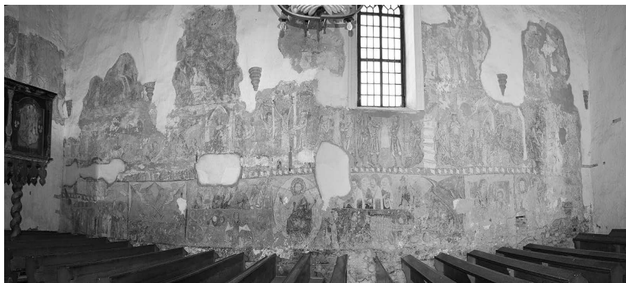
A bögyözi templom északi falán lévő 76 négyzetméteres 14-15. századi falkép

a ciklus egységes, szakrálissá emelt lovagi témáját, de részleteiben mindig eltérő ábrázolását tekintve Európában s – nem lehet túlzás kijelenteni – a világon egyedülálló jelenség.