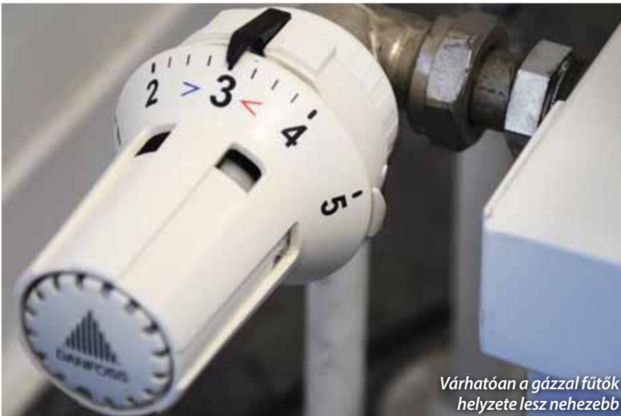
Várhatóan a gázzal fűtők helyzete lesz nehezebb

A kormány által meghozott rendelkezés szerint a lakossági fogyasztóknak továbbra is biztosított a rezsicsökkentés, de a jövőben rezsicsökkentett áron fogyasztható földgáz és villamosenergia mértéke megváltozik. A szadai lakosok is augusztustól már a magasabb összegű számlákra számíthatnak.