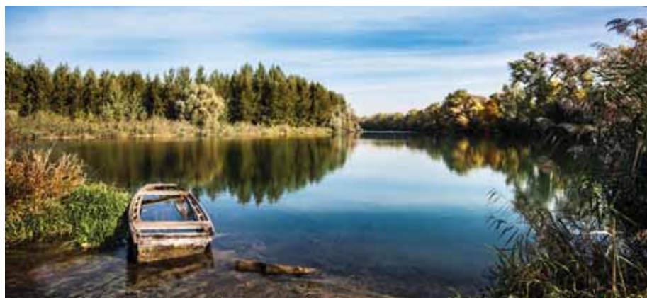
Apadnak a Szadához közeli felszíni és felszín alatti vizek

Az ivóvízellátási fejlesztéseket érintő felvetésünkre a DMRV azt a tájékoztatást adta, hogy tervben van Szada regionális gépházának gépészeti felújítása és a Gesztenyefa utcában új gerincvezeték építtetése, amely a település magasan fekvő részeinek vízellátásán javít majd.