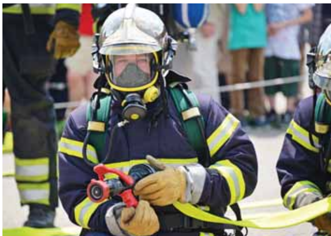
Szerencsére kevesebb otthoni tüzet kellett oltani

A GHTP összegzése szerint a szervezet a kitűzött céljait 2021-ben teljesítette, a meghatározott feladatokat végrehajtotta. A 2022-es céljaik között szerepel többek között: a tűzesetek, műszaki mentések számának visszaszorítása a hatósági prevenció eszközök és a lakosság tájékoztatása segítségével, különös tekintettel a szabadtéri tűzesetekre; az otthoni létesítményekben a tűzesetből származó halálesetek megelőzése; a szénmonoxid-mérgezők, az épített környezetben keletkezett tűzesetek, valamint a szabadterületek vegetációs tüzeinek megelőzése. Raffai Ferenc