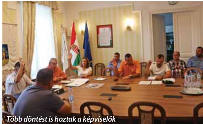
Több döntést is hoztak a képviselők

Szada Nagyközség Önkormányzat képviselő-testülete 2022. július 14-én tartotta a nyári szünete előtti utolsó rendes testületi ülését. Több, az éves munkaterv alapján esedékes beszámoló, továbbá az önkormányzat közbiztonsági koncepciójának és éves feladattervének elfogadása mellett döntés született a Szada Nova NKft. Alapító okiratának aktualizálásáról, valamint a társaság részére eredetileg biztosított pénzügyi források közötti belső átcsoportosításokról.