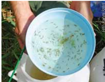
A lápi póc telepítésében szadai diákok is részt vettek

2022. márciusában 16 db lápi pócot fogtak be a természetes 2. sz. Pócos-tóból (bennszülött szadai állomány), melyek szaporításával összesen 2507 egyedet állítottak elő. Az ivadékokat több részletben idén májusban természetes élőhelyekre (szadai 1. sz. és 2. sz. Pócos