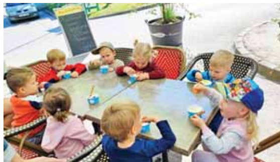
Finom fagyit fogyasztottak