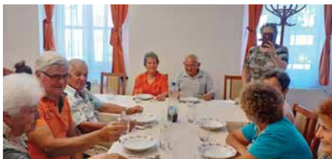
Ünnepeltek az idősök

AZ IDŐSEK NAPPALI KLUBJÁBAN hagyományosan júniusban köszöntjük születésnaposainkat. Az ünneplést ezúttal összekapcsoltuk egy közös főzős programmal.