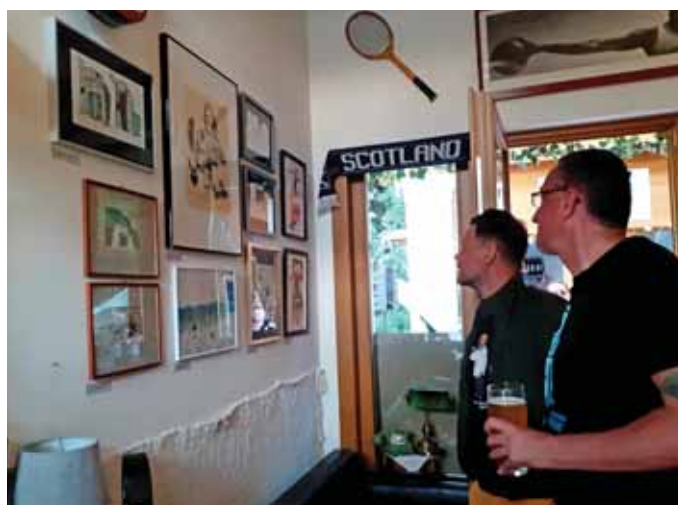
A szűk hely sem volt probléma