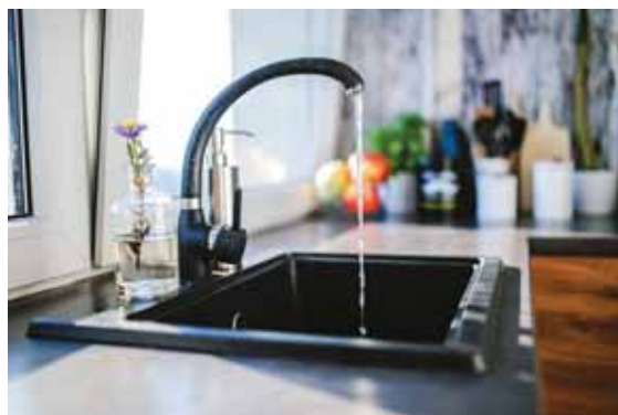
Hosszú távon is érdemes takarékoskodni a vízzel