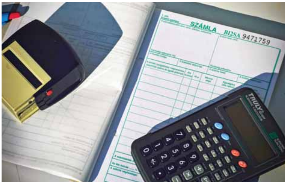
A NAV a weboldalán egy külön információs részt hozott létre a témában