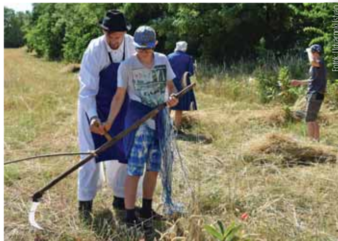
Nem könnyű kaszával aratni a búzát