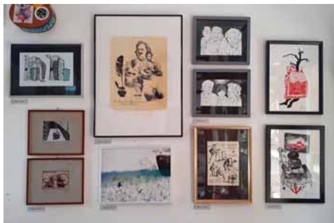
Egyedi bemutatót lehet látni

és a Pom Pom meséi) több generáció nőtt fel!