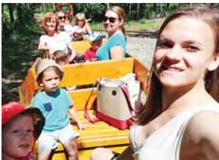
Kimozdultak a szabadba

Bölcsődei csoportunk 11 gyermekéből 9 gyermek a szadai óviban fogja folytatni a játékot, tanulást, tapasztalatszerzést. Reméljük, olyan szeretettel gondolnak majd vissza a Babóca bölcsődei csoportukra, mint mi gondolunk rájuk.