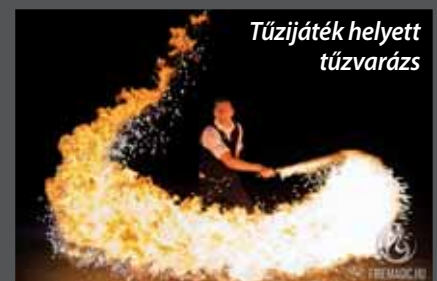
Tűzijáték helyett tűzvarázs

zijátékot, és természetesen idén sem lesz része az augusztus 20-i ünneplésnek. Az ünnephez azonban hagyományosan hozzátartozik egy látványos elem, amely a Szadai Sportcentrumban a Szent István-napi mulatság keretében a tavalyi évhez hasonlóan ismét egy futurisztikus fényzsonglőr show lesz, amely közel 40 percen keresztül UV light show-t; környezet- és állatbarát, hangos robbanásokkal nem járó szikra show-t és pirográfiát (tűzírás) tartalmaz. Látható, hogy gazdasági és környezetvédelmi megfontolások mi-