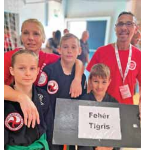
Kempokák és mestereik