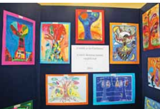
Kiváló rajzok készültek

A névadónk életrajzi adatait, festményeit, valamint Szadához való kötődését minden évben tanulmányozzuk, ismereteinket évről évre gyarapítjuk. Erről a tudásról adhattak számot diákjaink a Székely-akadályversenyen, ahol az alsó és felső tagozatosok külön útvonalakon, hat-hat állomáson teljesítették a feladatokat. Tari