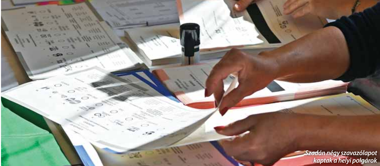
Szadán négy szavazólapot kaptak a helyi polgárok

lődési feladatfinanszírozás mértéke nem fedezi sem a fenntartás, sem a fejlesztés költségeit, a feladatfinanszírozás mértékének emelése szükséges” – jegyezte meg a TÖOSZ az állami finanszírozásról.