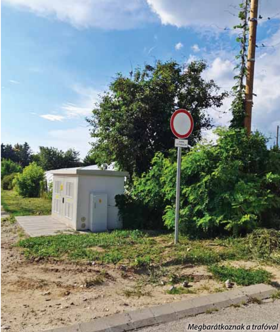
Megbarátkoznak a trafóval