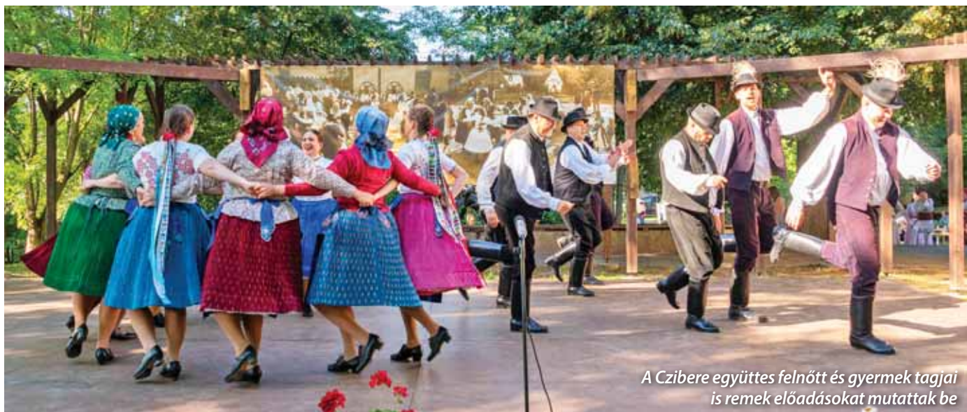
A Czibere együttes felnőtt és gyermek tagjai is remek előadásokat mutattak be