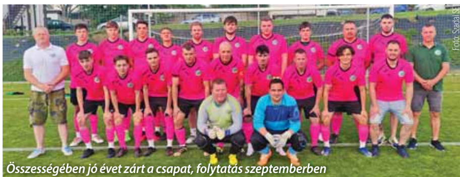
Összességében jó évet zárt a csapat, folytatás szeptemberben

Méltán lehetünk büszkék a szadai felnőtt labdarúgó-csapat Pest vármegye III. osztálybeli szereplésére. A 2023/24-es bajnokság végére – őszi szezonhoz képest két helyet javítva – a 6. helyet sikerült megszereznünk a tizennégy csapatos mezőnyben.