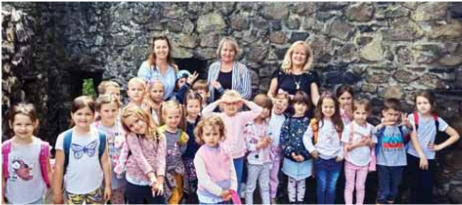
Jó hangulatú kirándulásokon vettek részt az ovisok

Tartalmas, sok programmal teli júniust tudhatnak maguk mögött a Székely Bertalan Óvoda-Bölcsőde óvodásai. Többek között évzáró ünnepségeken, kirándulásokon vettek részt.