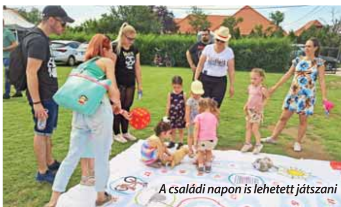
A családi napon is lehetett játszani

Idén is megrendeztük az óvoda családi napját a Szadai Sportcentrumban. A sok óvodás gyermek és családja felejthetetlen délutánt töltött el a 11 állomásos akadályversenyen. Az eseményt színesítette a sütemény- és zsákbamacskavásár, a tombolasorsolás, majd egy fergeteges Kalap Jakab-koncerttel zárult a nap.