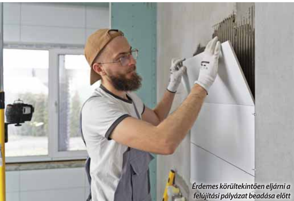
Érdemes körültekintően eljárni a felújítási pályázat beadása előtt

Július elsején indult el az otthonfelújítási program, amelynek keretében hosszabb futamidővel és többféle tevékenységre igényelhető támogatás. Akár szadai lakosok és ingatlanok is érintettek lehetnek.