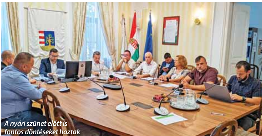
A nyári szünet előtt is fontos döntéseket hoztak

Szada Nagyközség Önkormányzat képviselő-testülete 2024. július 10-én rendkívüli ülést tartott, amelyen többek között további tervezésről döntöttek a Fenyvesligeti gyalogosátkelő kapcsán, gázenergia-beszerezéshez szükséges közbeszerzési eljárás lebonyolításáról határoztak, valamint állami terület megszerzését kezdeményezték.