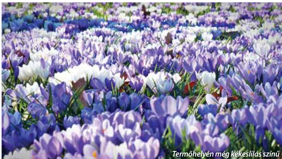
Termőhelyén még kékeslilas színű

Már nem annyira a hagyomány őrzése, hanem a biztonságos élelmiszer-előállítás és a természetes környezet megtartása miatt fontos értékelni, számba venni és ösztönözni Szada élelmiszer-termelő kertészeti kultúráját. Sorozatunkban ezúttal egy különleges, sáfránytermesztő kisgazdaságot mutatunk be.