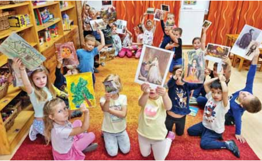
A gyerekek érdekében történik minden fejlesztés, jobbtús

Véget ért a 2023/24-es nevelési év a Székely Bertalan Óvoda-Bölcsődében. Az intézmény vezetője részletesen is összefoglalta mindazt, ami szakmai szempontból kiemelkedő volt.