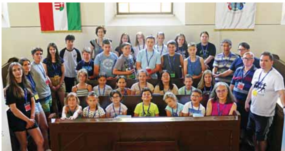
Öröm és békesség hatotta át a táborokat

A nyár a kikapcsolódás, a pihenés és a nyaralás időszaka. Végre kiszakadhatunk a megszokott hétköznapi napokból és pihenhetünk, vagy éppen kipróbálhatunk új dolgokat. Ugyanakkor a nyár a gyermekek számára a táborozás időszaka is. Sokféle tábor várta őket az idén is, ami segített a dolgozó szülőknek, hogy jó helyen tudhatták csemetéiket, ugyanakkor a gyermekeknek is sok új élményt, izgalmas kalandokat hozott.