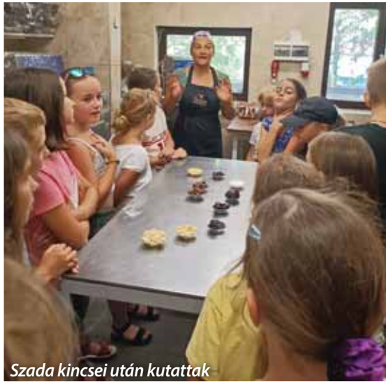
Szada kincsei után kutattak