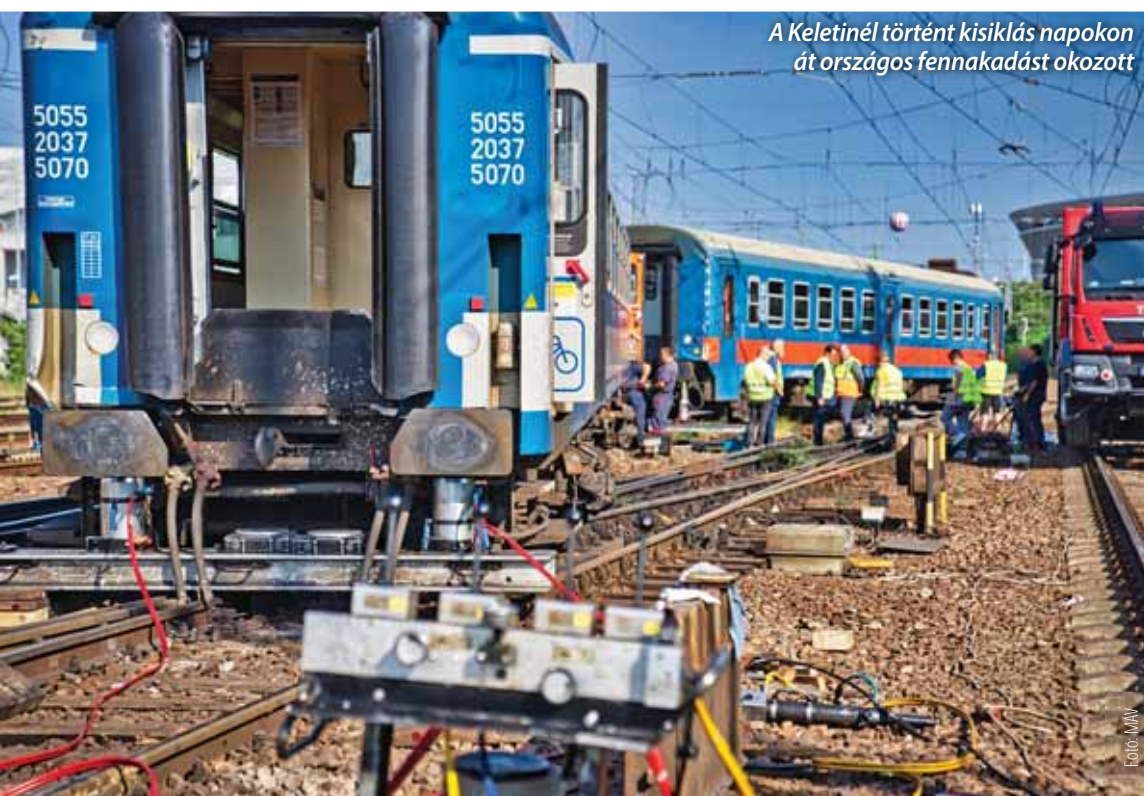
A Keletinél történt kisiklás napokon át országos fennakadást okozott

„A közlekedési »alapjoggal« való figyelemelterelést, illetve a MÁV-Volán átszervezését rendre kommunikációs eszköznek, valamint politikai pótcselekvések tartjuk. Egyrészt a közösségi közlekedés biztosítását mint az állam kötelességét az állampolgárai felé a hatályos 2012. évi XLI. (személyszállítási) törvény már szabályozza – a most bejelentett kritériumokkal gyakorlatilag azonos módon. Másrészt a MÁV és a Volán átalakítása évtizedeken, kormányzatokon átívelően a normális szolgáltatást helyettesítő kifogás – hogy mennyire sikeres, azt jól mutatják az 50 éves járművek és a bezárt vasútvonalak. A közszolgáltatások színvonalának érdemi növekedését tehát nem a cég-